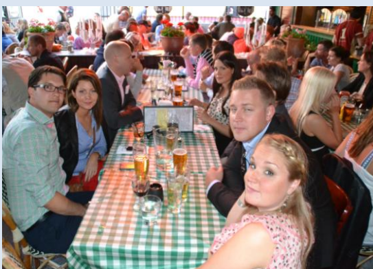
Middag på O'Learys.