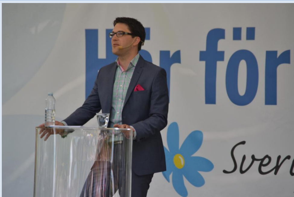
Jimmie Åkesson.