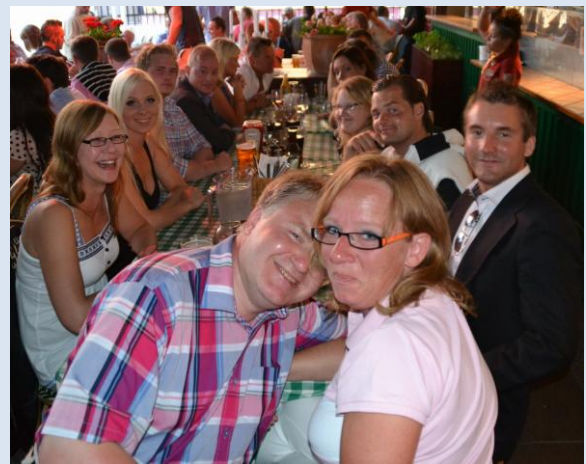
Middag på O'Learys.