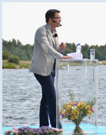
Jimmie Åkesson.