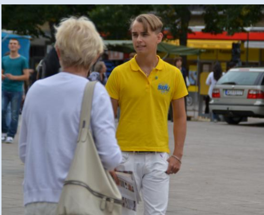
Axel Heder.