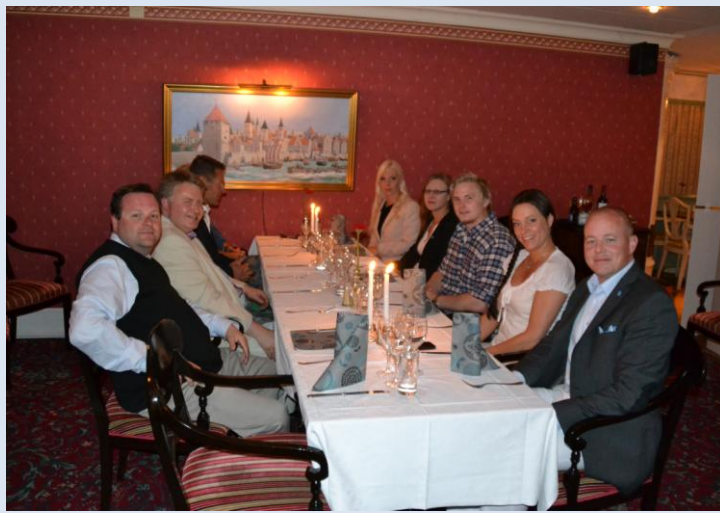
Middag på Wisby hotell.