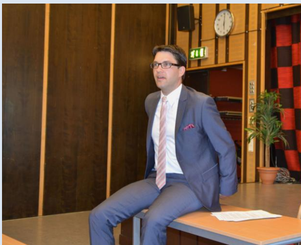
Jimmie Åkesson.

Sedan följde en lång frågestund, då Jimmie svarade på frågor från medlemmarna. De områden som berördes var SD:s inställning till fritt cabotage, skatter på drivmedel, transport via land – och järnväg, förnyelsebara energikällor, upphandling av kött som producerats på ett sätt som inte lever upp till svensk djurskyddslagstiftning, återbetalning av koldioxidskatt på dieseldrivna fordon inom jord – och skogsbruk, samt finansiering av sjöräddning.