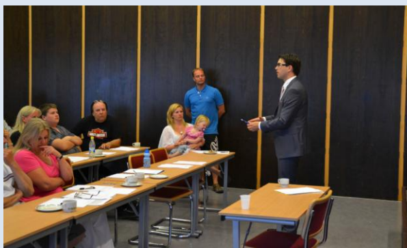
Jimmie Åkesson svarar på frågor.

Utöver detta fick Jimmie redogöra för vad som avses med öppen svenskhet, och förklara hur det kommer sig att s k ”gömnda” flyktingar (läs illegala invandrare) kan söka och få vård och ändå förbli ”gömnda”. En väldigt öppen och diskussion fördes också kring frågor av intern snarare än politisk karaktär. Sammanfattningsvis var det ett mycket trevligt och givande möte!