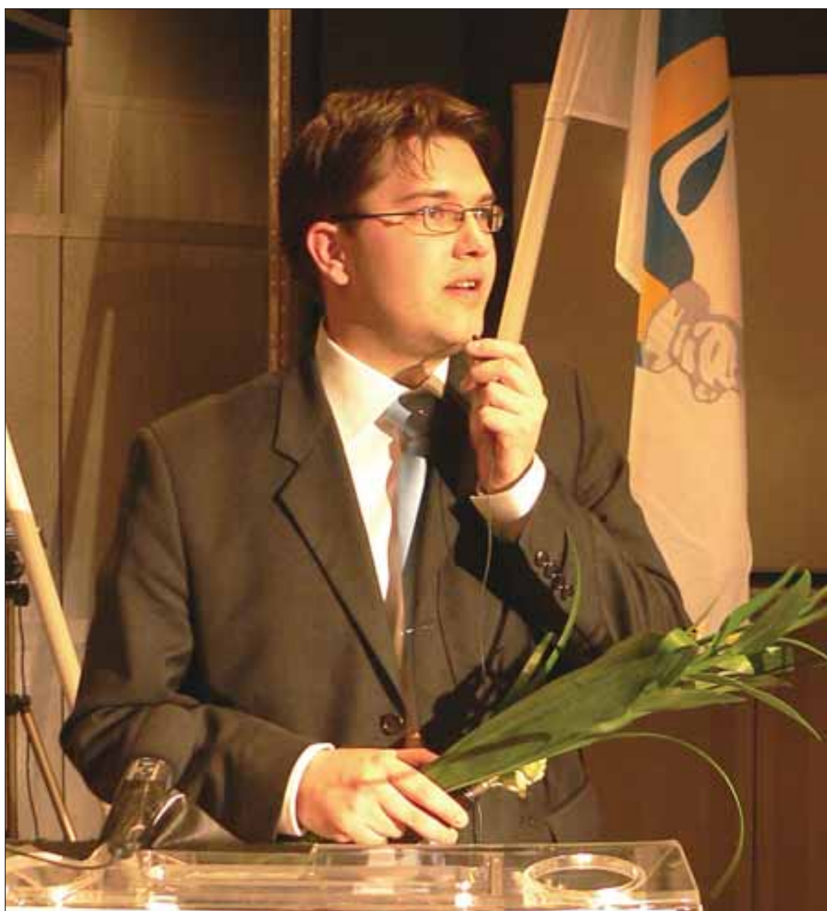
Jimmie Åkesson från Sölvesborg valdes till ny partiledare vid Sverigedemokraternas riksårsmöte i Norrköping helgen 7-8 maj. Han efterträder Mikael Jansson, som innehaft posten sedan 1995. Åkesson säger att hans främsta utmaning blir att få fart på partiet inför valet nästa höst.

ungefär samma nivå som både miljöpartiet och kristdemokraterna gjorde innan de kom in i riksdagen. Möjligheterna till ett verkligt genombrott på riksnivå är alltså stora. Jimmie Åkesson är hoppfull.