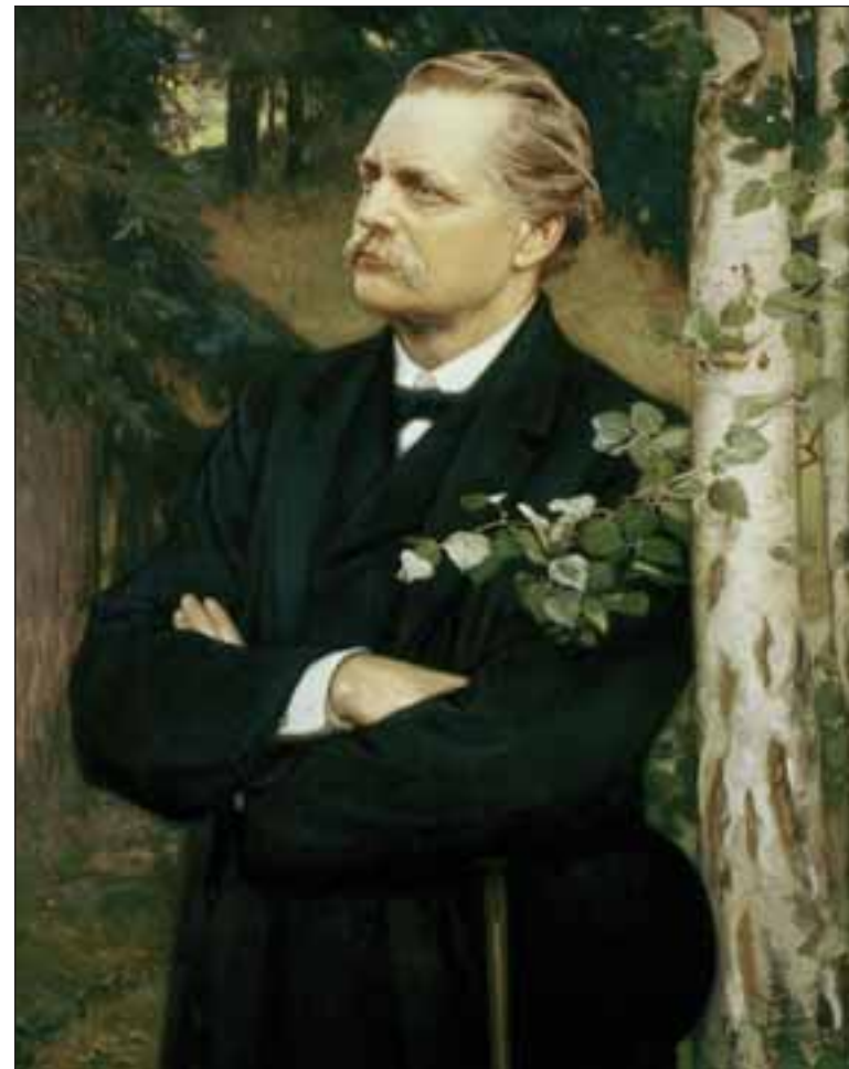
Artur Hazelius, 1833-1901