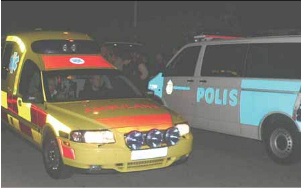
Natten mellan 5 och 6 juni attackerades en sverigedemokratisk tillställning i utlanterna av Växjö. Fönster krossades, tårgas kastades in i lokalen och flera bilar som stod parkerade utanför totalförstördes. Totalt skadades 18 sverigedemokrater, varav en fick föras till sjukhus i ambulans.

Sverigedemokraterna attackerades återigen av militanta vänsterextremister