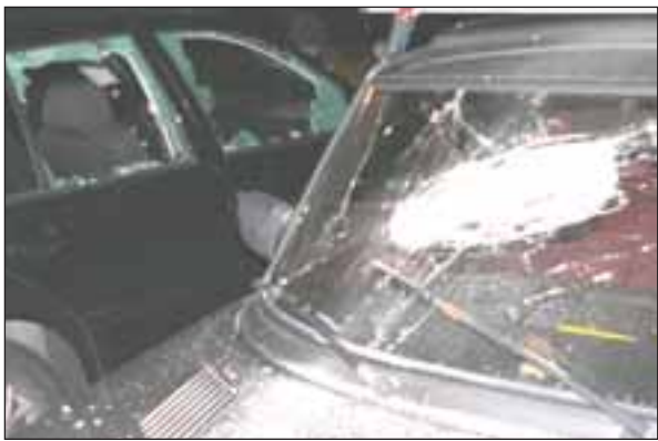
Flera bilar som stod parkerade i anslutning till lokalen totalförstördes. Förutom festdeltagarna drabbades en boende i området. En kvarlämnad kniv vittnar om att attacken var välplanerad.