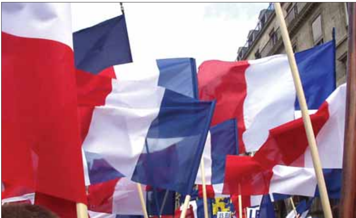
Vive la France! Efter fransmäns och holländarnas entydiga nej till den nya EU-grundlagen råder stor osäkerhet om såväl grundlagens som unionens framtid. Storbritannien skjuter upp sin folkomröstning och Estlands parlament har beslutat att lägga ratificeringsprocessen på is.

De är inte heller glada över planerna på att inkludera Turkiet i EU. Låt här inte finnas några oklarheter: den enda anledningen till en sådan strategi är att fylla Västeuropa med asiatiska väljare, vilka för alltid ska förhindra att nationalistiska partier, de nya uppstickarna i politiken, ska kunna hamna i regeringsställning. Etablissemang vet att nationalismens tid har kommit, att den inte kan hållas tillbaka längre med tal om andra världskriget, och att en stor mängd proffspolitiker riskerar att förlora sina bekväma titlar och löner. Det gäller att försvara sin plats vid träget. Sådan korruption kan emellertid fransmännen vädra sig till på mils avstånd, och den gamla franska upp-