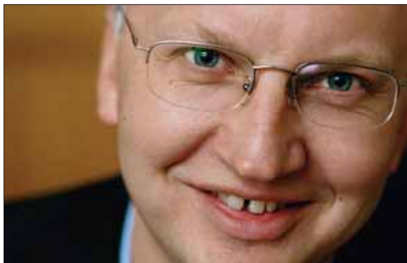
Per Nuder propagerar för ökad invandring.

Den berättar att svensk arbetsmarknad under denna period har varit stabil och förändrats med 10 procent i vardera riktningen; antingen med 10 procents bortfall av arbetsplatser eller med 10 procents tillkomst av nya arbetsplatser. År 2003 tillkom 430 000 arbeten medan 470