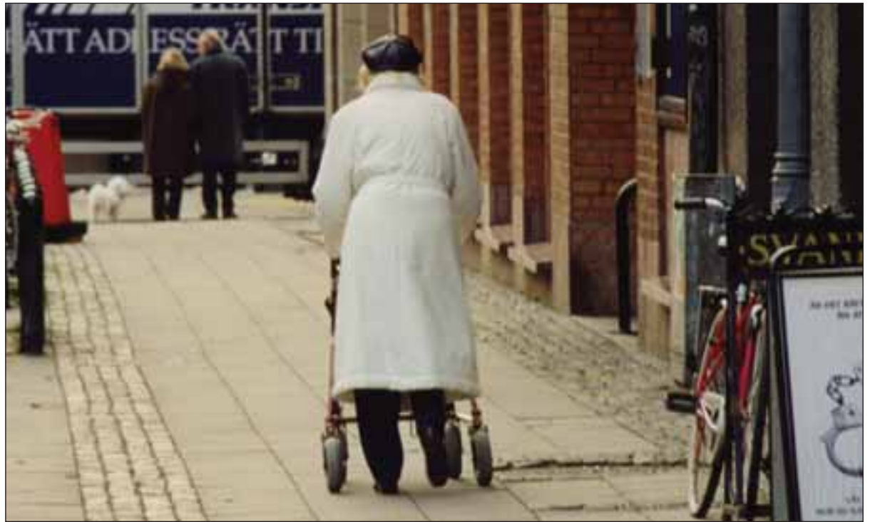
En jämförelse mellan garantipensionerna och äldreförsörjningsstödet ger vid handen att den svenska pensionären kommer till korta gentemot nyttjare av äldreförsörjningsstödet, vilket artikelförfattaren ser som en skymf mot svenska pensionärer. Foto: Björn Söder.

Inom det reformerade ålderspensionssystemet gäller följande: Bostadstillägget till pensionärer, BTP, utgör 91 procent av en boendekostnad upp till maximalt 4 500 kronor per månad, för ensamstående boende i tvåbäddrum högst 2 000 kronor per månad. Storleken på BTP påverkas av pensionärens årsinkomst. Därutöver ingår 5 procent av förmögenhet samt ytterligare 10 procent av förmögenhet över 75 000 för ogift respektive 60 000 kronor för gift. Som förmögenhet räknas i dessa fall privat bostadsfastighet. Tredje paragrafen i lagen om ÄFS: Bestämmelsen innebär att äldreförsörjningsstöd endast utges om den stödberättigade tar ut samtli-