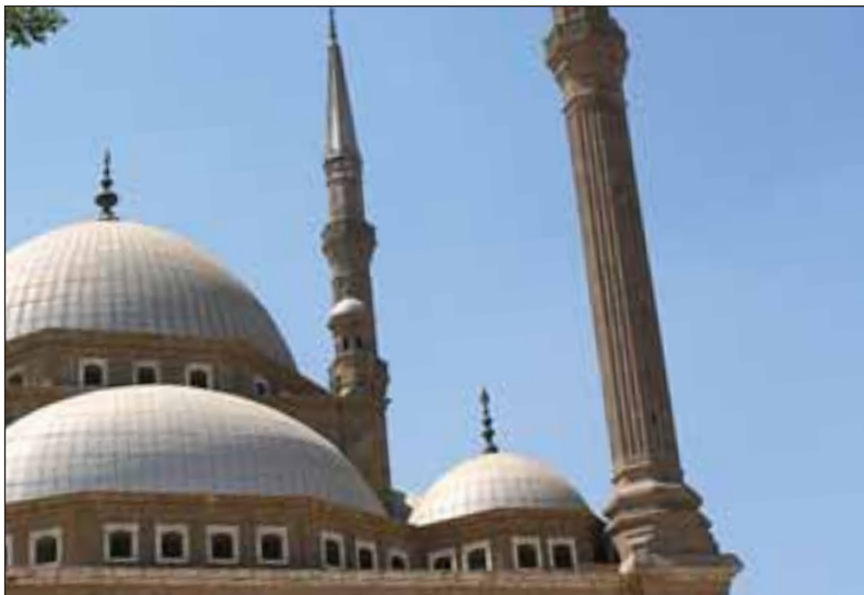
Skolavslutningar i kyrkan är en gammal tradition som på senare är ifrågasatts. I Ornsköldsvik föreslog muslimer att skolavslutningen ska firas i moskéer vissa år, vilket artikelförfattaren menar inte har någon anknytning till svenska traditioner.

I år har Skolverket i en skrivelse tolkat skolförfattningen vad gäller skolavslutningar. Formuleringen är kryptisk och tyder på en viss vända vid utformningen av texten: "Om den utformas så att tonvikten ligger på traditioner, högtidlighet och den gemensamma samvaron och inte på religiösa inslag kan skolavslutningen i kyrkan anses vara försvarligt".