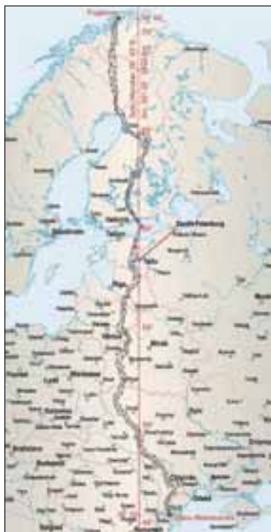
34 mätpunkter i Struves meridianbåge - varav fyra i Sverige - har fått status som världsarv på Unescos lista.

Nu har 34 mätpunkter i Struves meridianbåge – varav alltså fyra i Sverige – fått status som världsarv på Unescos lista. De fyra topparna utgör tillsammans vårt fjortonde världsarv och i Finland – som varit drivande i nomineringen av Struves meridianbåge till Unescos lista – har sex av mätpunkterna nu klassats som världsarv.