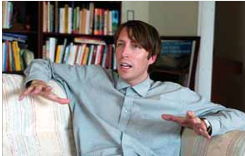
Återigen har SD-Kurirens chefredaktör, Richard Jomshof, som också sitter i Sverigedemokraternas partistyrelse, fått en påminnelse om demokratitillståndet i Sverige. Yrkesförbudet från Blekinge och Växjö gäller nu också i Lessebo kommun.