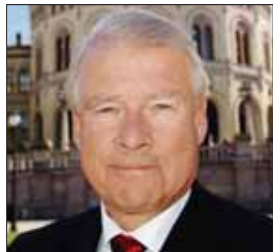
Carl I Hagen, partiledare för Fremskrittspartiet sedan 70-talet, gjorde sitt bästa val någonsin.

Jag har stadigt blivit mer överbevisad om att detta kommer att gå bra [...] Därför kan jag säga att det är med visst vemod, men också med glädje, att jag nu överräcker ordförandeklubban till dig, Siv. Lycka till på färden, sade Hagen under den lite känslolagda stunden som alltid inleder sig vid ett ordförandebyte. Sverigedemokraternas partiordförande, Jimmie Åkesson, kommenter-