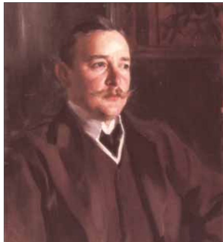
Erik-Axel Karlfeldt, 1864-1931

Om det nu mot förmodan fortfarande finns någon som fäster någon vikt vid upprop från Ung Vänster, är det uppenbarligen så att den senaste tidens påtvingade medlemsrevision borde föranleda en revidering av den uppfattningen.