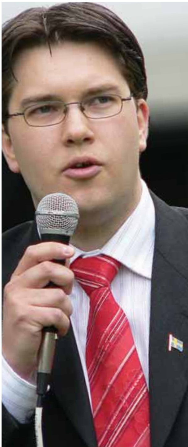
JIMMIE ÅKESSON SVERIGEDEMOKRATERNAS PARTIORDFÖRANDE