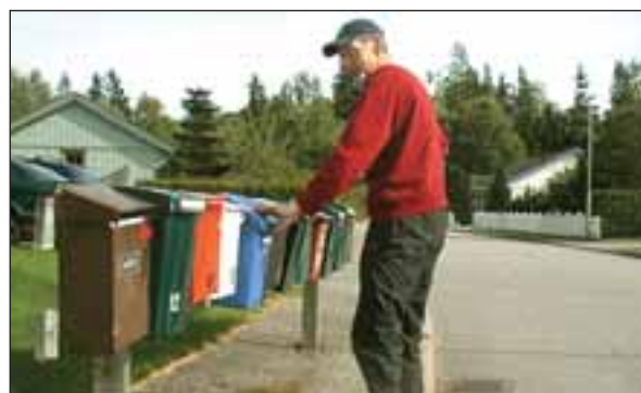
Brevlådorna ville aldrig ta slut, men i Gävle fick man ut över 40 000 valtidningar och det visade sig också på valnatten ge resultat...