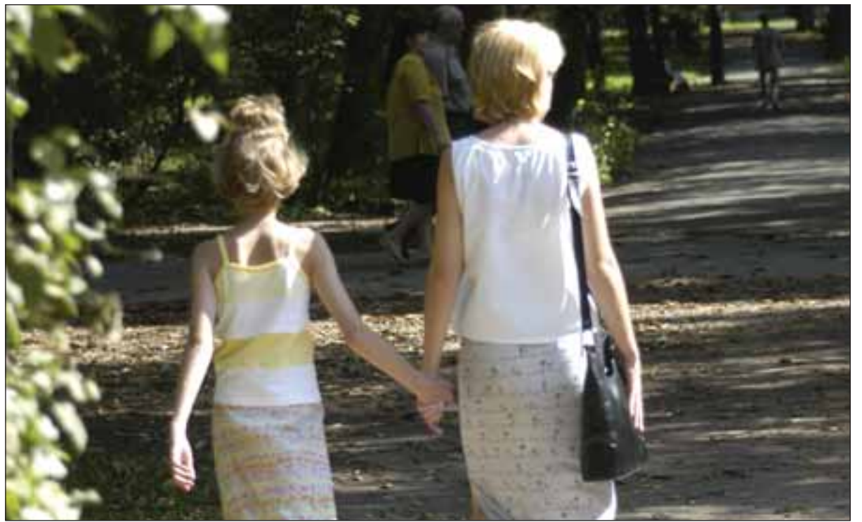
I det mångkulturella samhället riskerar svenska flickor och kvinnor att utsättas för brutala överfallsvåldtäkter.

"det är inte lika fel att våldta en svensk tjej som att våldta en arabisk tjej, säger Hamid. Den svenska tjejen