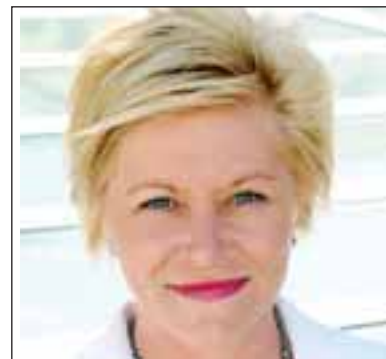
Siv Jensen, nyvald ledare av Fremskrittspartiets Stortingsgrupp, förmodas bli partiets nästa partiledare.