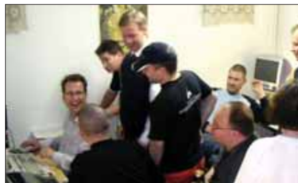
Kyrkovalet visas inte på tv, utan partikamrater över hela landet samlades kring datorer för att följa röstsammanräkningen. Här en valvaka i Stockholm.