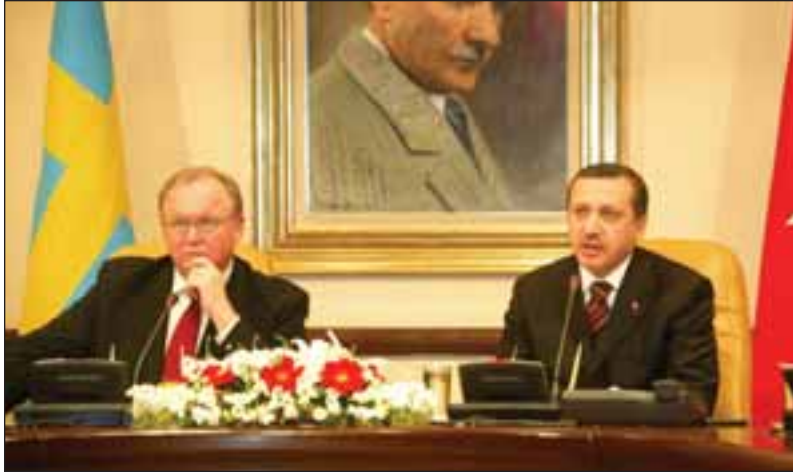
Turkiets premiärminister Recep Tayyip Erdogan vägrar att erkänna folkmordet på de kristna armenierna. Här sittandes tillsammans med Sveriges statsminister, Göran Persson, som stödjer Turkiet som medlem i EU.

Pamuk står åtalad enligt en ny strafflag som antogs den 26 september 2004, en strafflag som ersatte Turkiets då 78 år gamla brottsbalk. Lagen var ett villkor för att Turkiet skulle kunna inleda förhandlingar om EU-medlemskap i fjol. Vad som dock