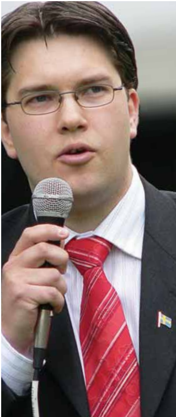
JIMMIE ÅKESSON SVERIGEDEMOKRATERNAS PARTIORDFÖRANDE