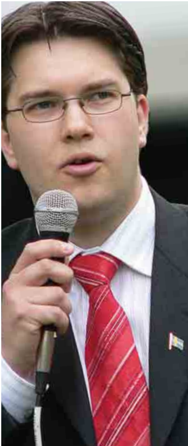
JIMMIE ÅKESSON SVERIGEDEMOKRATERNAS PARTIORDFÖRANDE