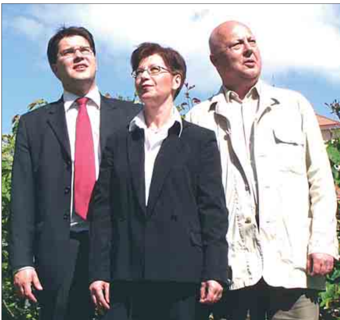
Framgångarna i Ungt val har fått partiets presidium att blicka mot nya höjder. Sverigedemokraterna är den enda verkliga uppstickaren inför höstens val.

□ Medias plötsliga intresse kan inte vara en slump. Sedan i vintras har