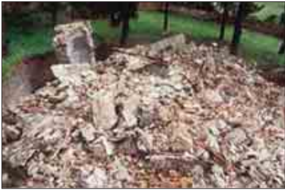
Under de senaste fem åren har drygt 150 kyrkor och kloster förstörts i Kosovo, detta enligt uppgifter från den ortodoxa kyrkan i Serbien.

De nya moskéerna förses med skyltar med tacksägelse för gåvorna från Saudiarabien, Iran och Före-