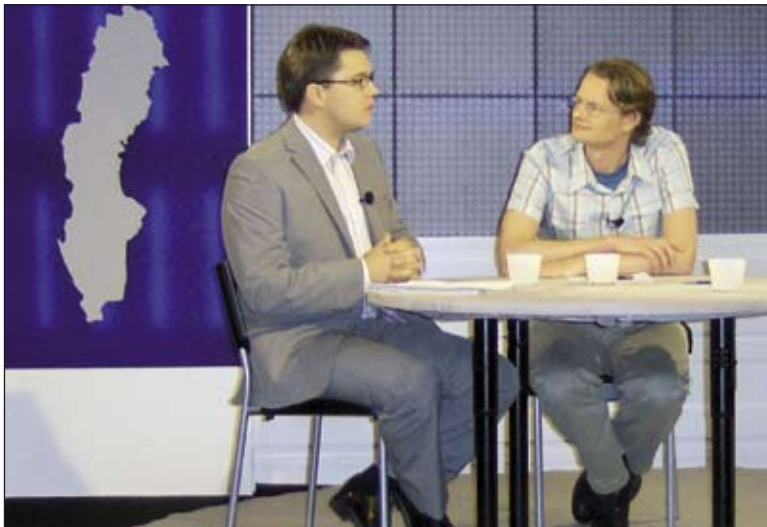
Sd:s partiledare Jimmie Åkesson under debatten med moderaternas partisekreterare Per Schlingmann i TV8.

Det går helt enkelt inte att prata seriöst om välfärdspolitiken utan att också beröra massinvandringen. Vi är inte ensamma om den analysen. Danska Valfärdskommisionen ( http://www.velfaerd.dk/ ) beräknar att de framtida, danska besparingsbehoven inom välfärden skulle minska med nästan tre fjärdedelar om man stoppade invandringen