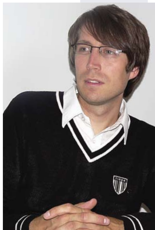
RICHARD JOMSHOF CHEFREDAKTÖR