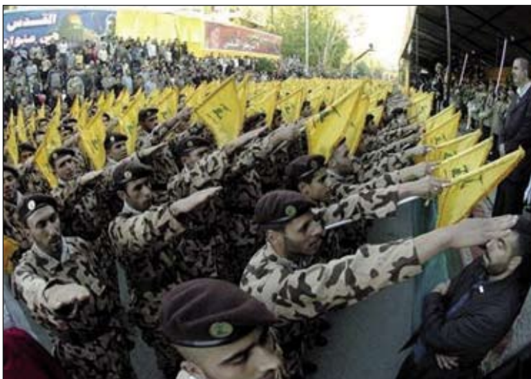
Antisemitismen är utbredd i den muslimska världen. Bilden visar anhängare till Hizbollah som gör den välkända nazisthälsningen.

På frågan om bokhandeln sålde mycket av Adolf Hitlers Mein Kampf, svarade den kvinnliga expe-