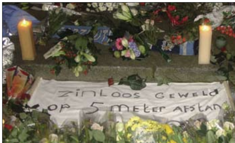
Omfattande protester följde efter mordet på Rinie Mulder, som hedrades med stora mängder blommor på platsen för dådet.

I detta fall var det dock inte muslimer som låg bakom upploppen, utan etniska holländare. Även mannen som sköts ihjäl av polisen var holländare. Rapporterna i vanlig media gjorde gällande att det var "vita" fotbollshuliganer som låg bakom upploppen och kravallerna. Det räckte dock med att skrapa på ytan för att en helt annan bild skulle framträda.