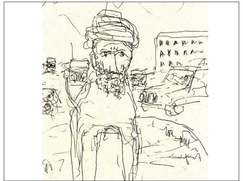
En av de teckningar föreställandes den muslimske profeten Muhammed som upprört muslimer över hela världen.

företag hotats på olika militanta islamistgruppers hemsidor på Internet; man uppmanar sina anhängare till bojkott av företagen eller till att "ta hämnd", samtidigt som företagens logotyper, namn samt kartor och adresser publicerats. I skrivande stund pågår således den "andra" Muhammedkonflikten för fullt, och hur den ska sluta är det ingen som vet. Den visar däremot med tydlighet att islam inte är en religion som andra.