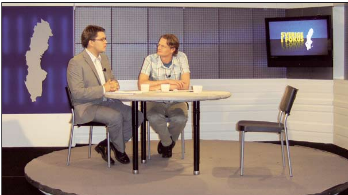
Sverigedemokraternas partiledare Jimmie Åkesson under debatten mot moderaternas partisekreterare Per Schlingmann i TV8.