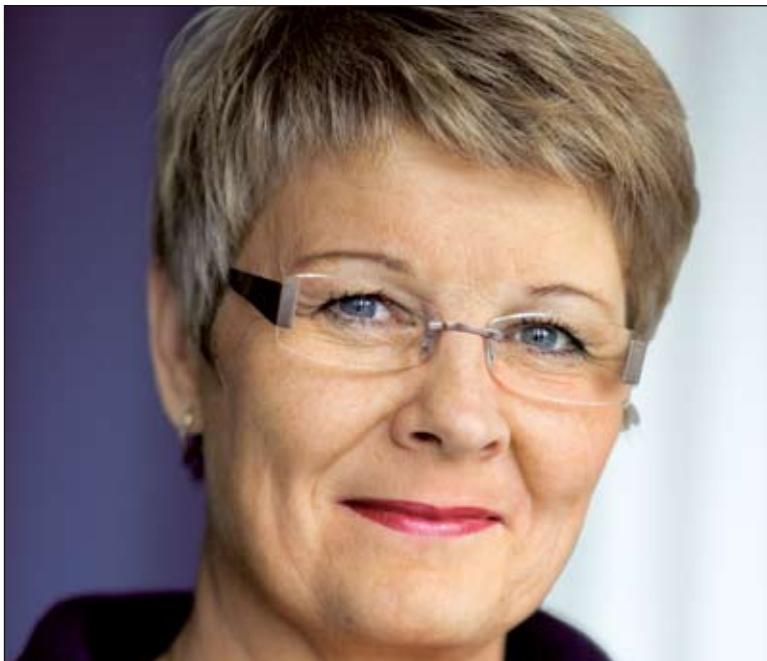
"Det var faktiskt inte vi svenskar som byggde Sverige. Det var människor som kom utifrån", hävdar centerpartiets ledare Maud Olofsson.

mycket lång, men jag tror att detta räcker för att ni ska förstå vad det är jag försöker säga. Det bör kanske påpekas att några av dessa personer och rörelser framfört tankar och idéer som inte ligger i linje med vad jag kanske tycker och tänker. Naturligtvis. Men de är alla en del av vår svenska historia. De utgör alla en viktig del av den grund på vilken dagens samhälle vilar.