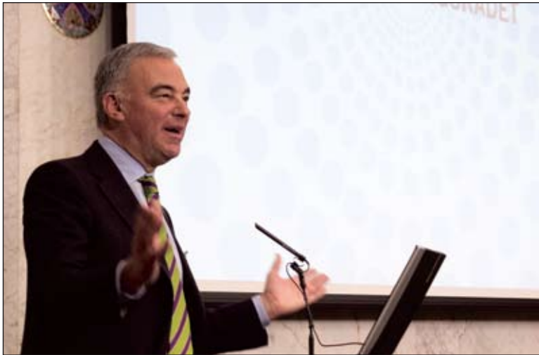
Sveriges Högskole- och forskningsminister, Lars Leijonborg, vill ha en statlig imamskola.

För att utforma förslag på hur imamutbildningarna ska se ut kommer regeringen tillsätta en statlig utredning. Men Lars Leijonborg själv ser i nuläget inget behov av imamutbildning på högskolenivå. Han tänker sig snarare en eftergymnasial