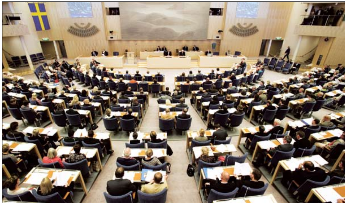
"Det är en seriös kandidat som knackar på portarna för att komma in i riksdagen", menar valforskaren Sören Holmberg.

Debatter, utfrågningar och TV-sänt riksrådsmöte. Nog togs den mediala bevakningen av partiet till nya nivåer under det gångna året, även om jag bestämt vill hävda att vårt verk-