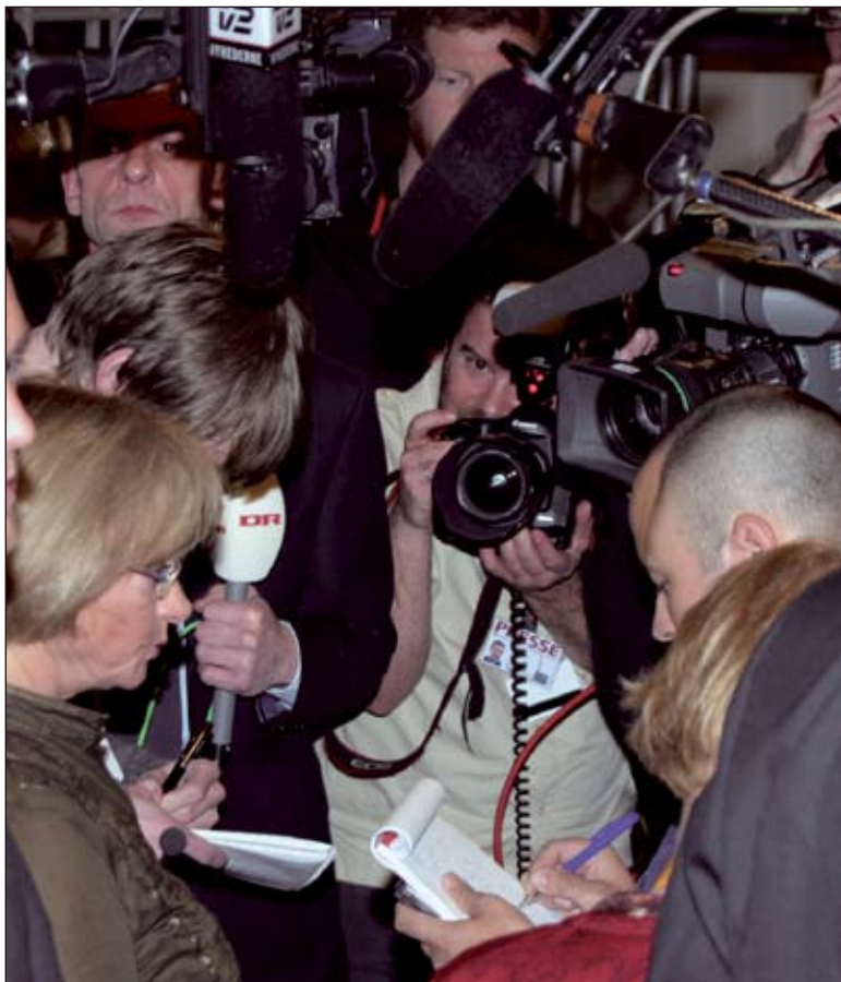
Att det var Pia Kjærsgaard som stod i centrum denna kväll, råder ingen som helst tvekan.

Det är två nöjda sverigedemokrater som lämnar Danmark och valvakan på Christiansborg och beger sig hemåt igen, laddade med nya kunskaper och färdigheter. Om det är möjligt i Danmark ska det banne mig vara möjligt i Sverige med.