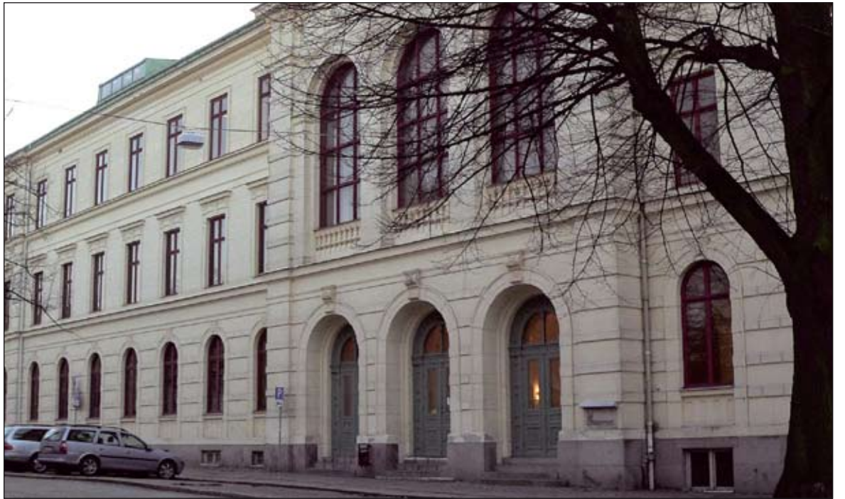
Justitieombudsmannen riktar stark kritik mot att gymnasieskolan af Chapman i Karlskrona hindrade Sverigedemokraterna från att sprida partiets budskap på skolan inför valet 2006.

Jag vill också understryka vikten av att en skolledning inte faller undan för sådana invändningar från elevernas sida som ytterst kan leda till en urholkning av de grundlags-