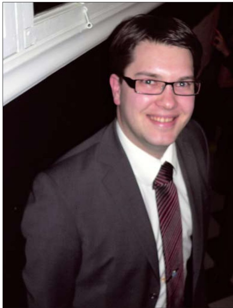
Sverigedemokraternas partiledare Jimmie Åkesson anländer till jubileumsfesten.