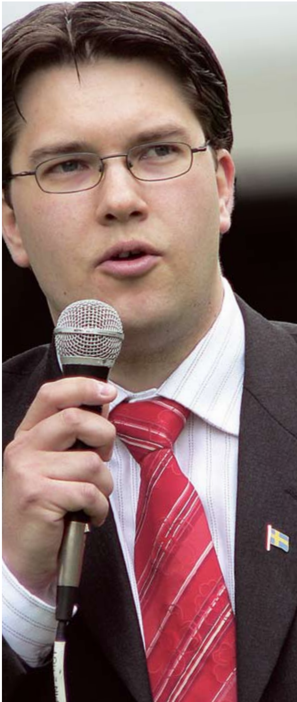
JIMMIE ÅKESSON SVERIGEDEMOKRATERNAS PARTIORDFÖRANDE