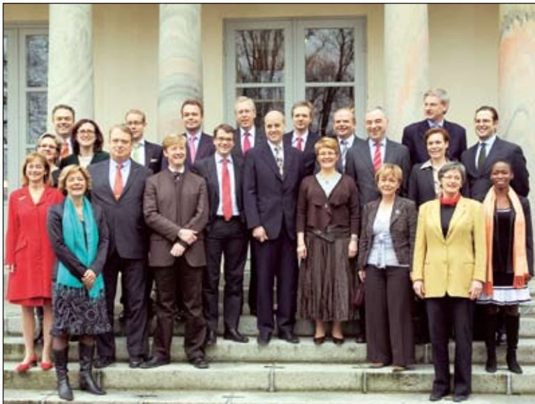
Den svenska regeringen håller på att genomföra vad författaren kallar en "tyst statskupp".

Problemet är att svenska folket aldrig har fått ta ställning i denna mycket viktiga framtidsfråga. I valrörelsen 2006 var debatten obefintlig, och inga klara alternativ fanns för väljarna att ta ställning för, eller emot. Ej heller kommer det svenska folket att få göra sin röst hörd via en folkomröstning. Regeringen planerar att genomföra dessa förändringar, med Socialdemokraternas goda minne, utan att låta folkviljan ha ett avgörande inflytande på beslutet. Detta trots att folkopinionen i Sverige på intet vis är för ett undertecknande av konstitutionen.