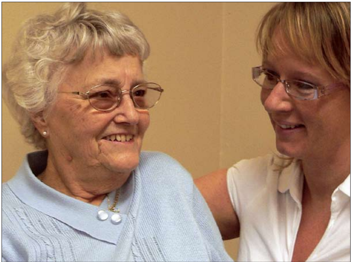
Det är dags att Sverige får en äldrevård värd namnet, en äldrevård där Sverigedemokraterna får vara med och sätta dagordningen.

Danmark har också infört en lag om förebyggande hembesök. Kommunen är skyldig att erbjuda de från 75 år och uppåt, två hembesök per år, där den äldres livssituation, vårdbehov, behov av hjälpmedel och aktivitetsbehov avhandlas. I Sverige finns en liknande skyldighet inskriven i socialtjänstlagen. Men lagen är ihållig och kommunerna har en benägenhet att tolka lagen utifrån ett budgetperspektiv, snarare än efter det faktiska