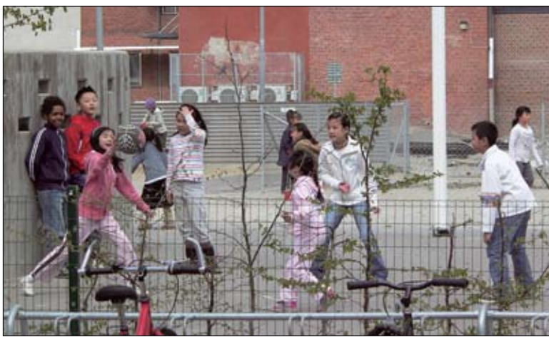
Antalet invandrare i Sverige blir allt fler. Bilden är tagen på en av Malmös skolor.

Vad står det då i de svenska skrivelserna och hur följer vi dessa? Sverige tar naturligtvis emot dem som går under FN:s flyktingkonvention samt kvotflyktingar. De som klassificeras som flyktingar enligt flyktingkonventionen är dock en liten minoritet av alla dem som vi väljer att ge asyl. Av alla som fick uppehållstillstånd 2006 var det endast 7 procent som fick uppehållstillstånd enligt FN:s flyktingkonvention, enligt Migrationsverkets hemsida. Förutom de flyktingar som faller under FN:s flyktingkonvention och som i