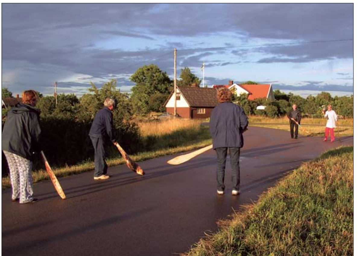
I Ryds socken på Öland har trillslagning alljämt en särskild plats i folkets hjärtan.

Som vid nästan all annan svensk folkidrott bestod priset oftast av att det förlorande laget fick bjuda vin-