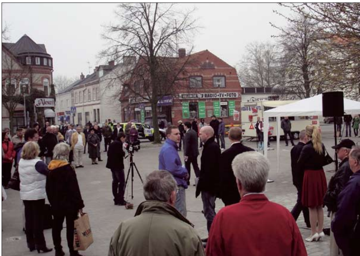
Sverigedemokraternas torgarrangemang i skånska Vellinge var välbesökt och uppskattat.