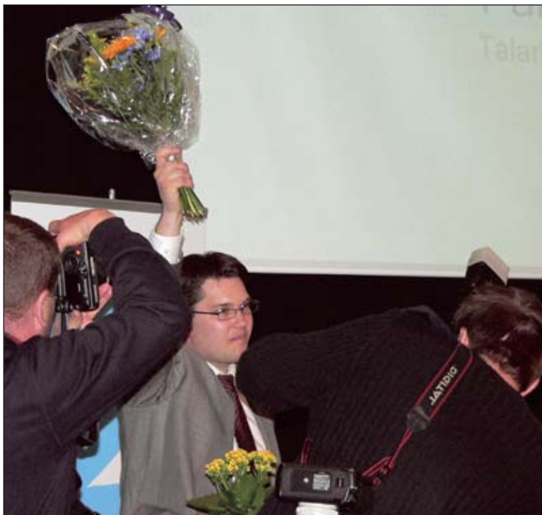
Partiordförande Jimmie Åkesson från Sölvesborg i Blekinge, återvaldes enhälligt och mottogs stående ovationer från årsmötesdeltagarna.

Dagen avslutades med middag. Vid middagsborden pratades det om kommunalpolitik, partievenemang och utbyttes tankar om de kommande årens valrörelser.