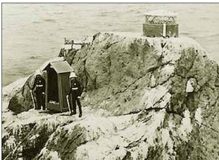
Storbritannien annekterade formellt Rockall i början av 1970-talet. Bilden med den brittiska vaktposten är från 1974.

I Norge har man däremot bromsat den negativa utvecklingen. Varför inte lära sig av Norge? ■