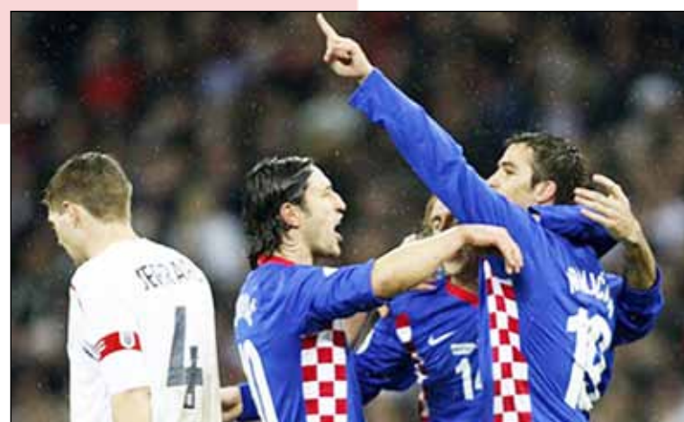
Krabaterna, förlåt kroaterna, firar ett mål på fotbollsplanen.

Under Trettioåriga kriget 1618-48 uppträdde kroater som legosoldater i den katolska kejsarliga armén. Kroaterna gjorde sig då kända som orädda och barska krigare och kom på lågtyska att betecknas som krabater, ett ord som småningom kom att införlivas med svenska