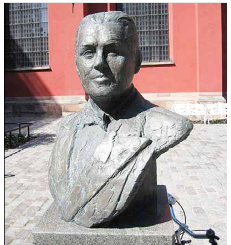
Byst av Jussi Björling utanför Jakobs kyrka i Stockholm.