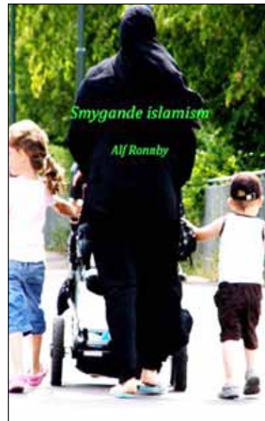
Smygislamiseringen belyses i ny bok.

regeln att den som kommer till ett annat land och en annan kultur gör väl i att anpassa sig till den nya miljön och "ta seden dit man kommer". Detta är en självklarhet för de flesta svenskar och troligen även för majoriteten invandrare, dock inte för etablissemangseliten inom politik, samhällsliv och media. Tvärtom, menar denna, är det de infödda svenskarna som måste anpassa sig till invandrarna.