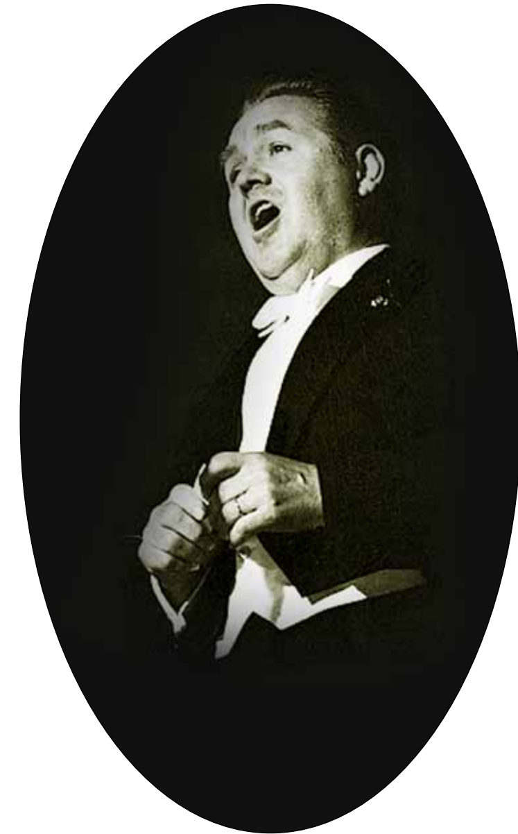
Jussi Björling bedårade en hel värld med sin stämmas välljud.

Den äldre Björlings sångundervisning har fortsatt intressera fack-