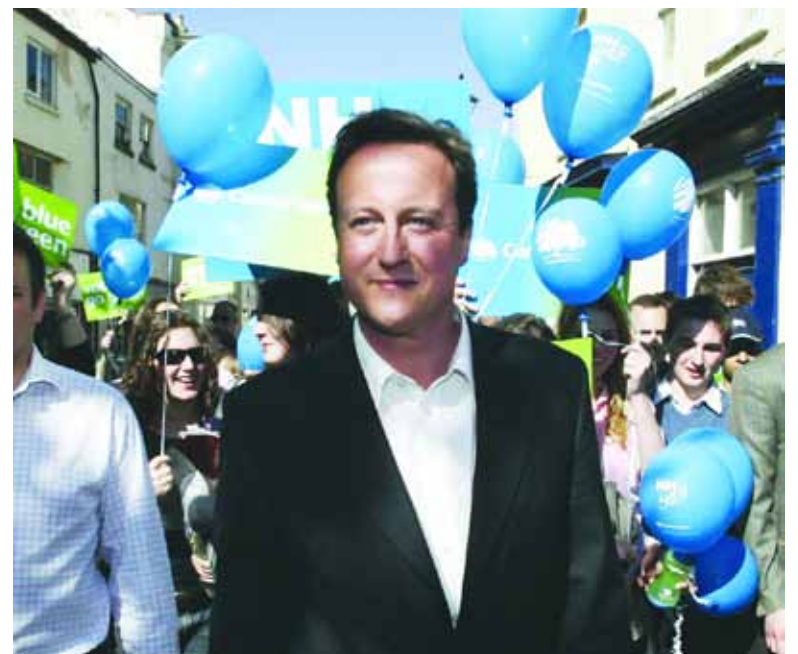
I fjol konstaterade Tysklands förbundskansler Angela Merkel att mångkulturen är ett misslyckande. Nu gör den brittiske premiärministern David Cameron detsamma.

– Det håller inte som alliansregeringen gör att enbart se integrationspolitiken som en jobbfråga. Som premiärministern säger så är det av största vikt att se till så att det existerar gemensamma värderingar i samhället och att tydligt ta avstånd från värderingar och handlingar som bryter mot de värderingar som råder i vårt land. ■