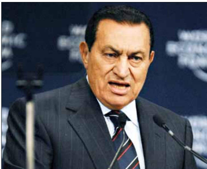
Egyptens diktator Hosni Mubarak störtades dessbättre. Men vad kommer efter?

Utvecklingen i Egypten är inte bara en nationell angelägenhet för landets 83 miljoner invånare. Även internationell storpolitik är i högsta grad inblandad. Landet hade under många år en fientlig inställning till den judiska staten Israel, men efter nederlaget i Yom Kippur-kriget 1973 insåg president Anwar Sadat – som efterträtt arabnationalisten Abdel Gamal Nasser