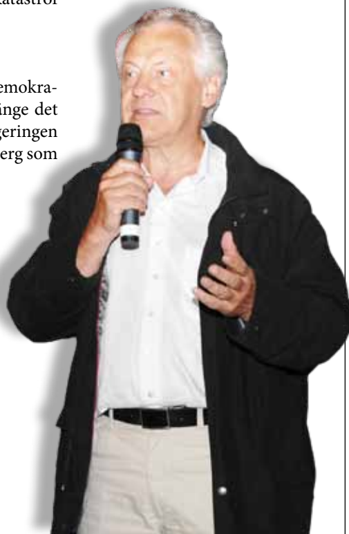
Bengt Westerberg - en samhällsdestruktör.