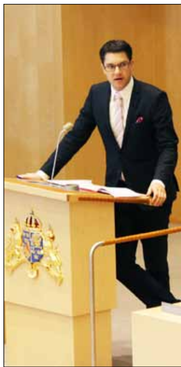
Jimmie Åkesson (SD) framhöll i riksdagsdebatten om extremism att de islamistiska terrordåden inte är några galningars verk utan frukten av högt motiverade individers engagemang.

Vi kan också konstatera att ordföranden för Sveriges Muslimska Råd (SMR) ena veckan förnekar att hon någonsin märkt av extremismen för att i nästa vecka avslöjas med att en man i hennes absoluta närhet för