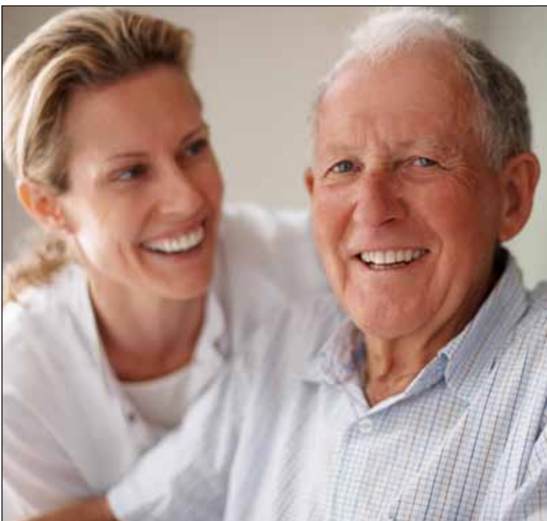
Vården är en av SD:s absolut viktigaste frågor.

Ett annat ämne som Sverigedemokraterna motionerat om är att det införs ett förbud mot användandet av livsmedel och produkter som innehåller kemikaliegruppen parabener. Förbudet skall gälla barn och ungdomar under 18 år, då de generellt sätt är mer känsliga för miljö-