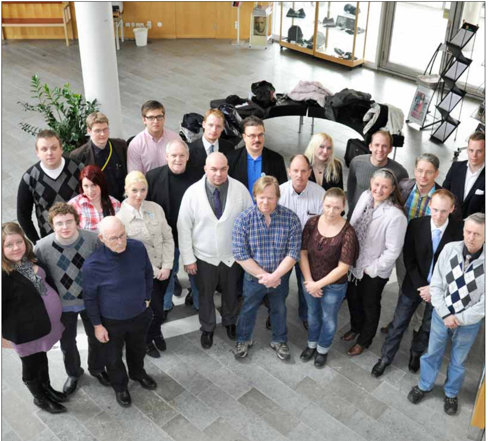
Entusiasmen och viljan att ge Sverigedemokraterna ett bra valresultat den 15 september är inte att ta fel på hos det här gänget från Västra Götaland!

► Valet den 19 september förde Sverigedemokraterna rakt in i riksdagen med 5,7 procent av rösterna. I valet till region Västra Götaland måste dock hela valet göras om.