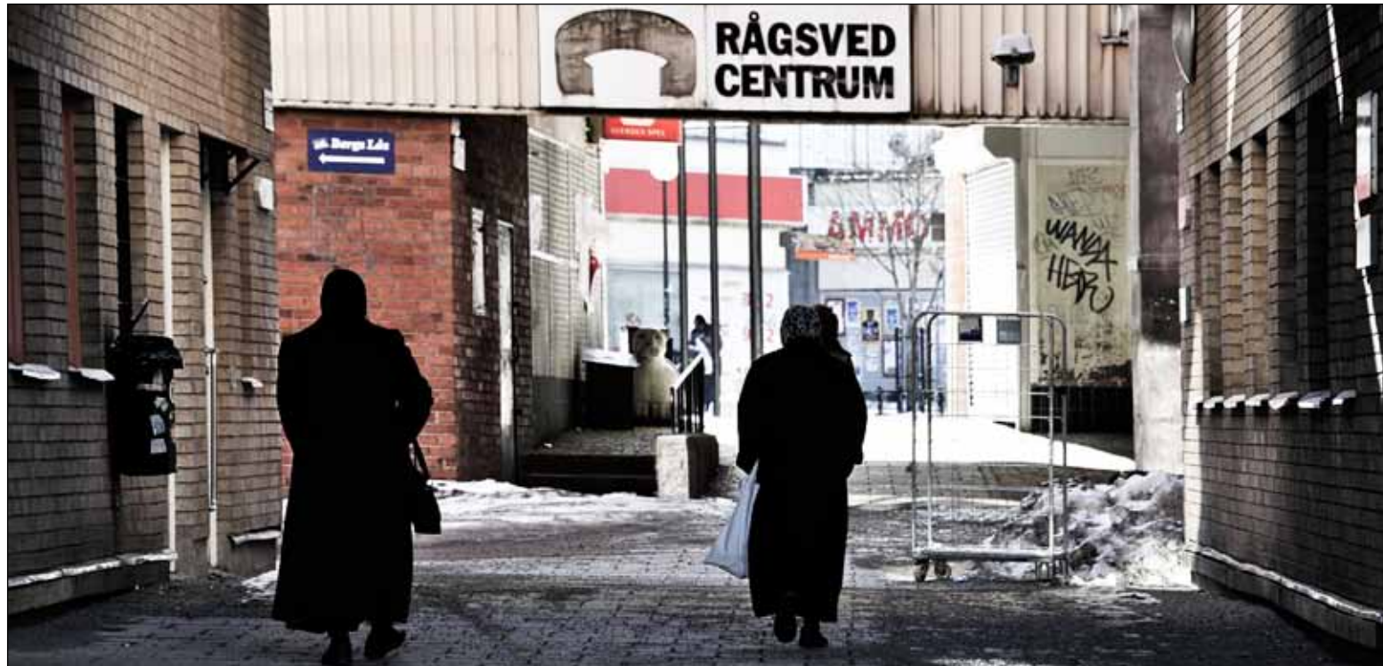
Trots fiaskot med Frankrikes nystartszoner föreslår den svenska regeringen en liknande politik i Sverige. Bilden från en av Stockholms invandrartäta förorter.

A NDERS BORG (M). Maud Olofsson (C) och Erik Ullenhag (FP) presenterar på Brännpunkt i Svenska Dagbladet den 10 mars ett regeringsinitiativ angående införande av så kallade nystartszoner. Tanken är att det ska skapas nya jobb i socialt utsatta invandrartäta förorter om man sänker kostnaden för företagen att anställa inom dessa områden. Vi inom Sverigedemokraterna motsätter oss av flera skäl tanken på nystartszoner. Först och främst är det en diskriminerande åtgärd mot såväl människor som företag. Alla företag kan på grund av EU-regler och sin geografiska placering inte omfattas av