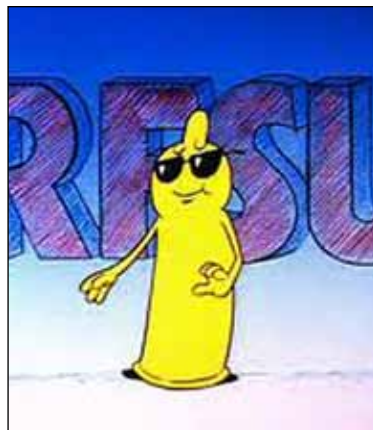
Allmänna arvsfonden favoriserar RFSU.

2/3 av RFSU:s budget, och vid sidan av organiserade homo-, bi-, trans-, poly-, pan- och andra prefixsexuella, är RFSU den enda organisationen som riskminimerande politiker lyssnar på, då de närmar sig sexualitetens våta myrmarker... De som antydde att det inte är alldeles självklart att skolan ska visa guppande hetero-, homo- och gruppsexakter för barn från 13 och uppåt, har naturligtvis redan förlorat. Det gjorde de i