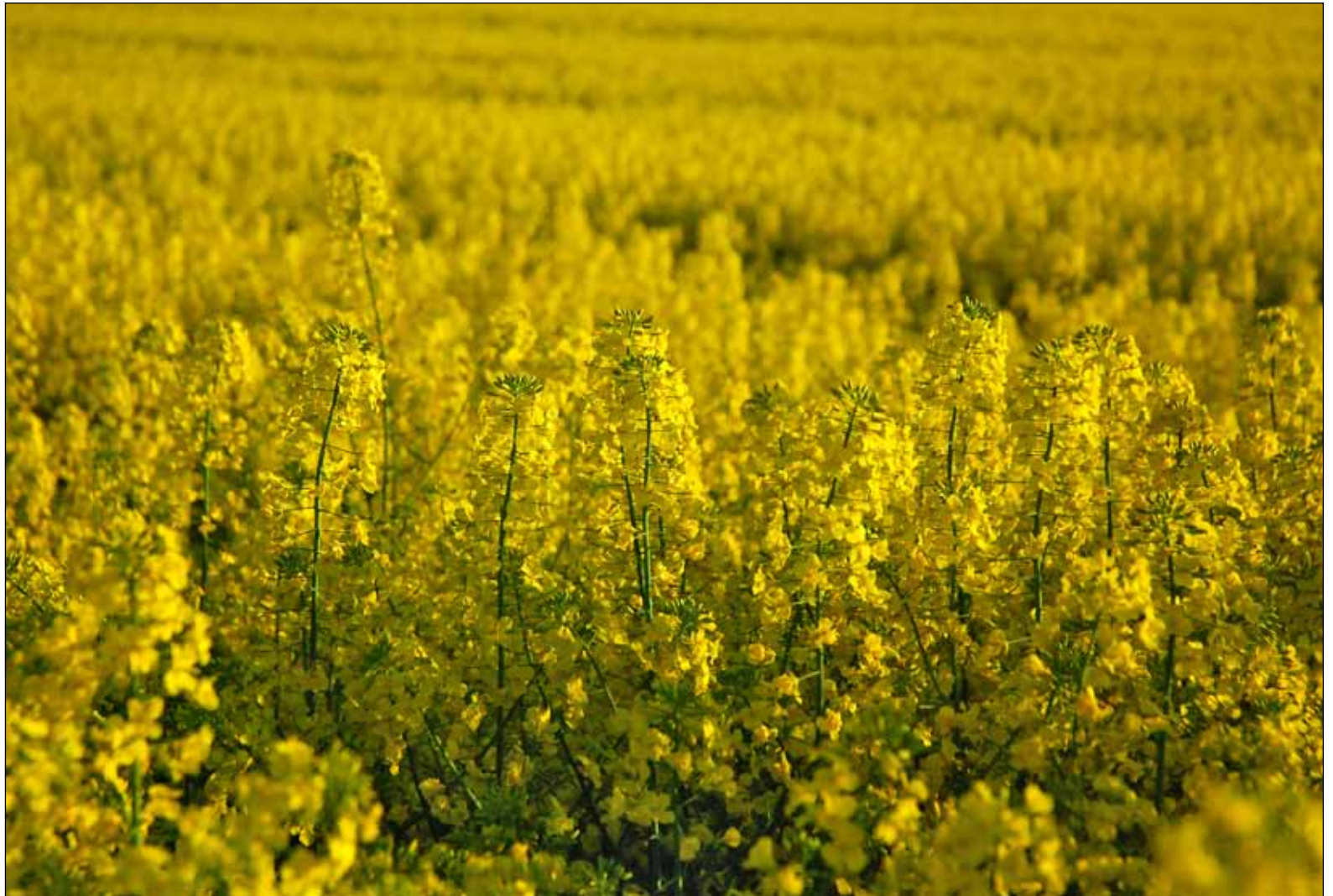
Raps är en gröda som utmärker jordbruksbygderna i den skånska regionen.

om att Rutinronden skulle kunna förbättra skåningarnas upplevelse av vården.