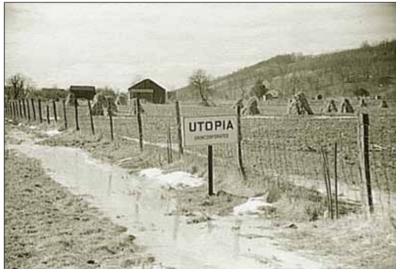
Den franske utopisten Charles Fourier grundade på 1800-talet ett samhälle i Ohio kallat Utopia. Det bor fortfarande människor där.

Statsminister Reinfeldt visar genom närmandet till Miljöpartiet att