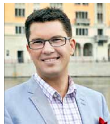
Jimmi Åkesson är riksdagens i särklass yngste partiledare.

– Att komma in som ny ledamot i riksdagen är säkert jobbigt i början, men att komma in som helt nytt parti utan vare sig organisation eller administration på plats har varit