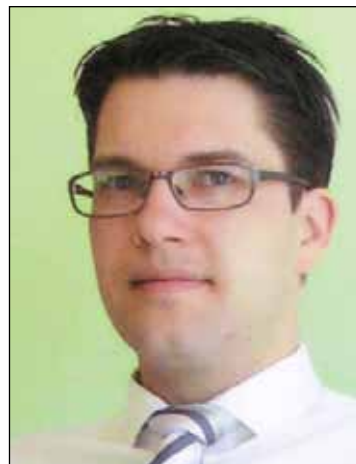
– Vi råder själva över vår utveckling, betonar Jimmie Åkesson.

– Vi har redan gjort skillnad och så länge vi fortsätter att bygga upp ett förtroende hos både väljare och andra partier, kommer vi att få ytterligare möjligheter att göra skillnad. Jag tycker att man kan se en tydlig skillnad redan nu när det gäller vår relation till de andra partiernas politiker i riksdagen, och det beror så klart på att de börjar förstå att vi är här för att ta ansvar. Vi har mer än tre år kvar av mandatperioden och mycket kommer att hända. Vi råder själva över vår utveckling. Vi har chansen och vi ska ta den!