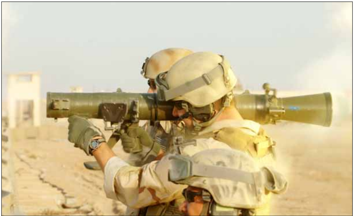
En SD-motion handlar om export av svenskt krigsmateriel. På bilden över amerikanska soldater med granatgeväret Carl Gustav.