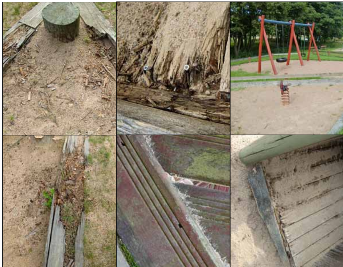
Så här eländigt såg det ut på lekplatsen före upprustningen.