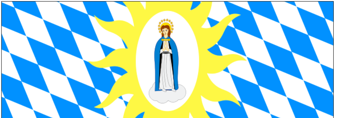
Katolska ligans standar med den heliga jungfrun i centrum.

Ligan hade initialt stora framgångar i Trettioåriga kriget. Man understödde under den berömde härföraren Johann Tserclaes Tilly på ett framgångsrikt sätt den tysk-romerske kejsaren. Således besegrade ”ligisterna” de protestantiska stridskrafterna vid slagen vid Vita Berget 1620 samt Lutter am Barenberge 1626. Vid Breitenfeld 1631 fick ligan dock ordentligt på tafs