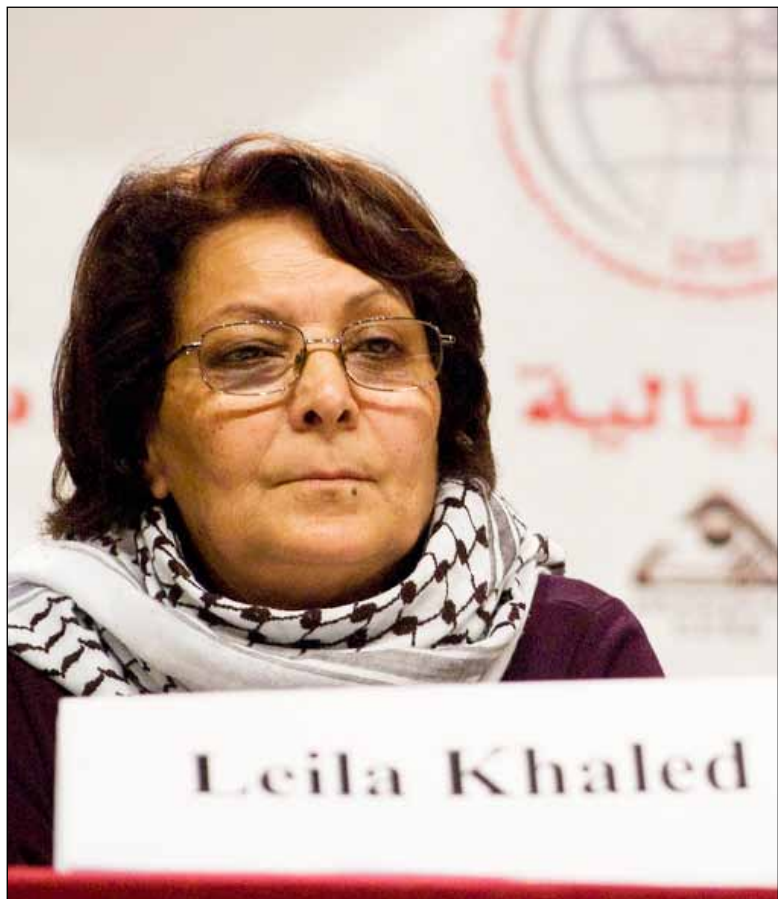
Den obotfärdiga terroristen Leila Khaled (PFLP).

U NGEFÄR SAMTIDIGT SOM socialdemokratiska partisekreteraren Carin Jämtin föreslog att Sverige borde få en muslimsk helgdag på bekostnad av en av de existerande svenska helgdagarna, anlände till Sverige en viss Leila Khaled (född 1944) som blivit en idolgestalt i propalestinska kretsar.