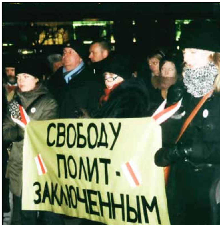
I januari hölls en demonstration mot Vitrysslands diktatur på Norrmalmstorg i Stockholm. varifrån bilden är hämtad.

Andra före detta sovjetrepubliker där det gamla förtrycket fortsätter ungefär som förut, låt vara utan den ideologiskt kommunistiska fer-