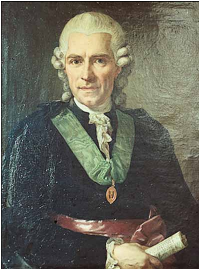
Torbern Bergman var, bland mycket annat, läskedryckens fader.

Inom kemien slog Bergmans talanger ut i full blom och han svarade för en banbrytande insats genom att grundlägga den kvalitativa och kvantitativa kemiska analysen. Därmed fick han också internationellt erkännande som kemist. Han erbjöds bland annat en tjänst hos konung Fredrik den store i Preussen, men då ingrep Gustaf III för att