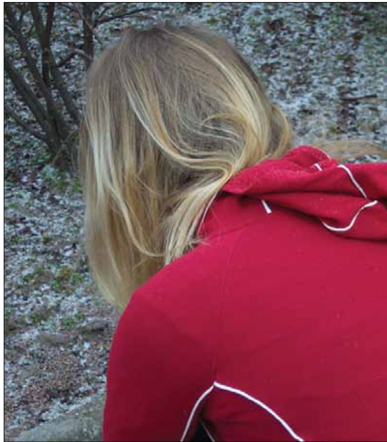
I det mångkulturella Sverige får svenska flickor och kvinnor finna sig i att utsättas för sexuellt våld av utlänningar och förövare med invandrarbakgrund.

I DN den 11 februari år 2000, med anledning av den då uppmärksammas gruppvåldtäkten i Rissne, framkommer det att det mycket väl kan finnas rasistiska motiv bakom