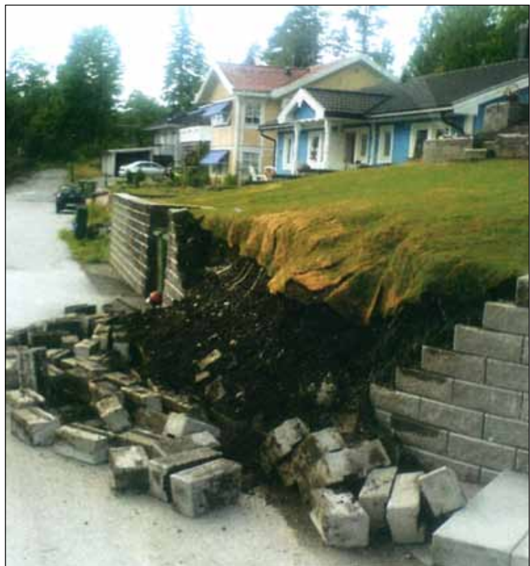
En del av intilliggande tomts mur rasade efter markförhöjningen och utsatte Torgerds dotter och barnbarn för livsfara.

-Jag har ju inte gjort något fel. Det är tekniska förvaltningen som talat om för mig var huset skall ligga.