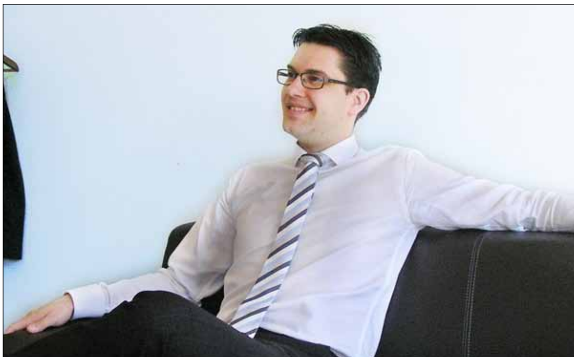
Trots en hård arbetsbelastning har Jimmie Åkesson fortfarande tid och energi att se glad ut!

Efter riksdagsinträdet kände ju många medlemmar i SD att vi nått ett viktigt mål, att vi äntligen tagit revansch på alla våra belackare och kommit in i demokratins finrum. Jag fortsätter därför att fråga Jimmie