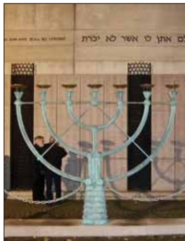
Förintelsemonumentet utanför Stora synagoga i Stockholm.