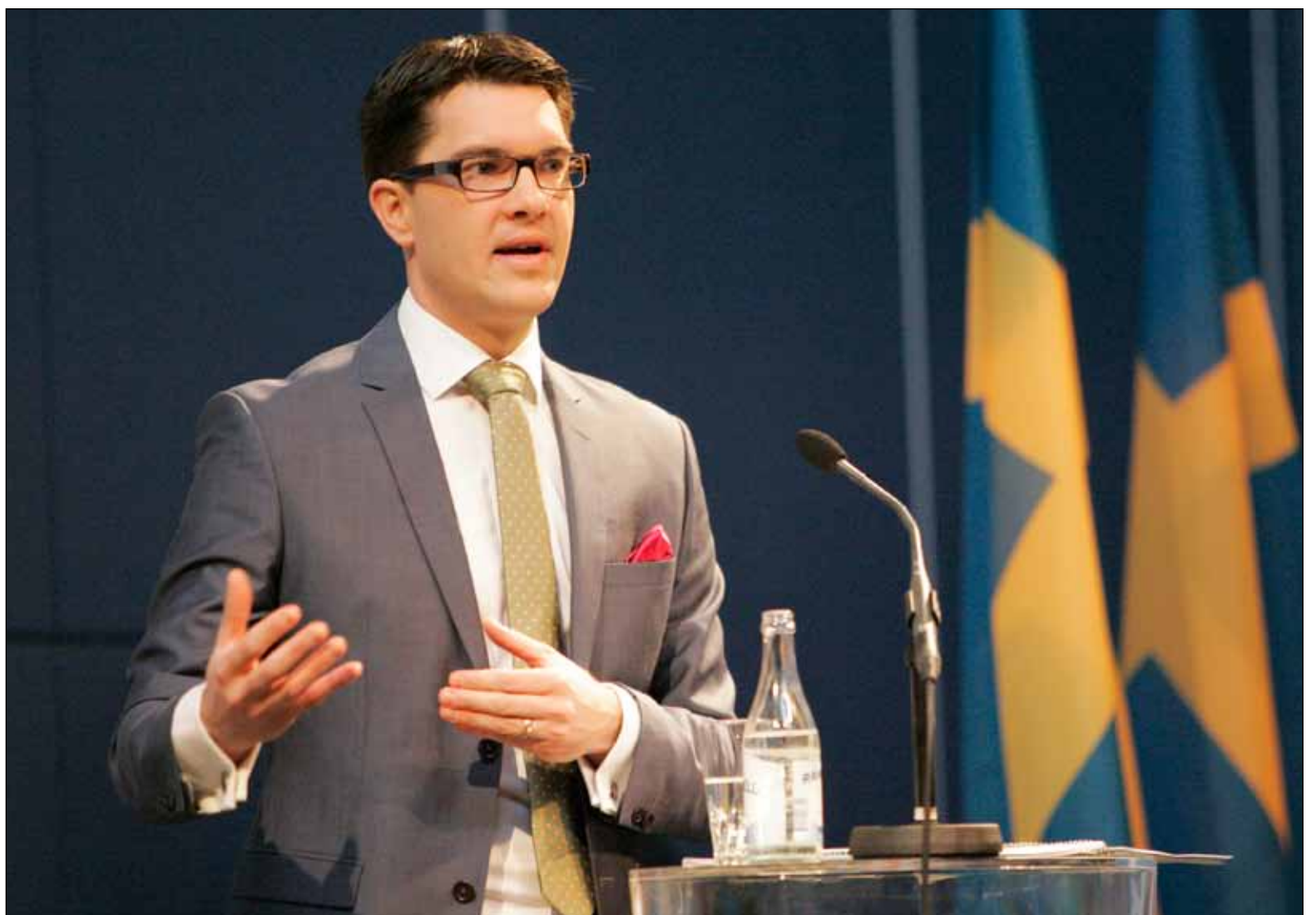
Det är hög tid för förändringar, framhöll Jimmie Åkesson när han puffade för det förslag till nytt principprogram som antogs vid landsdagarna.

► Nu är det officiellt: Sverigedemokraterna är ett socialkonservativt parti.