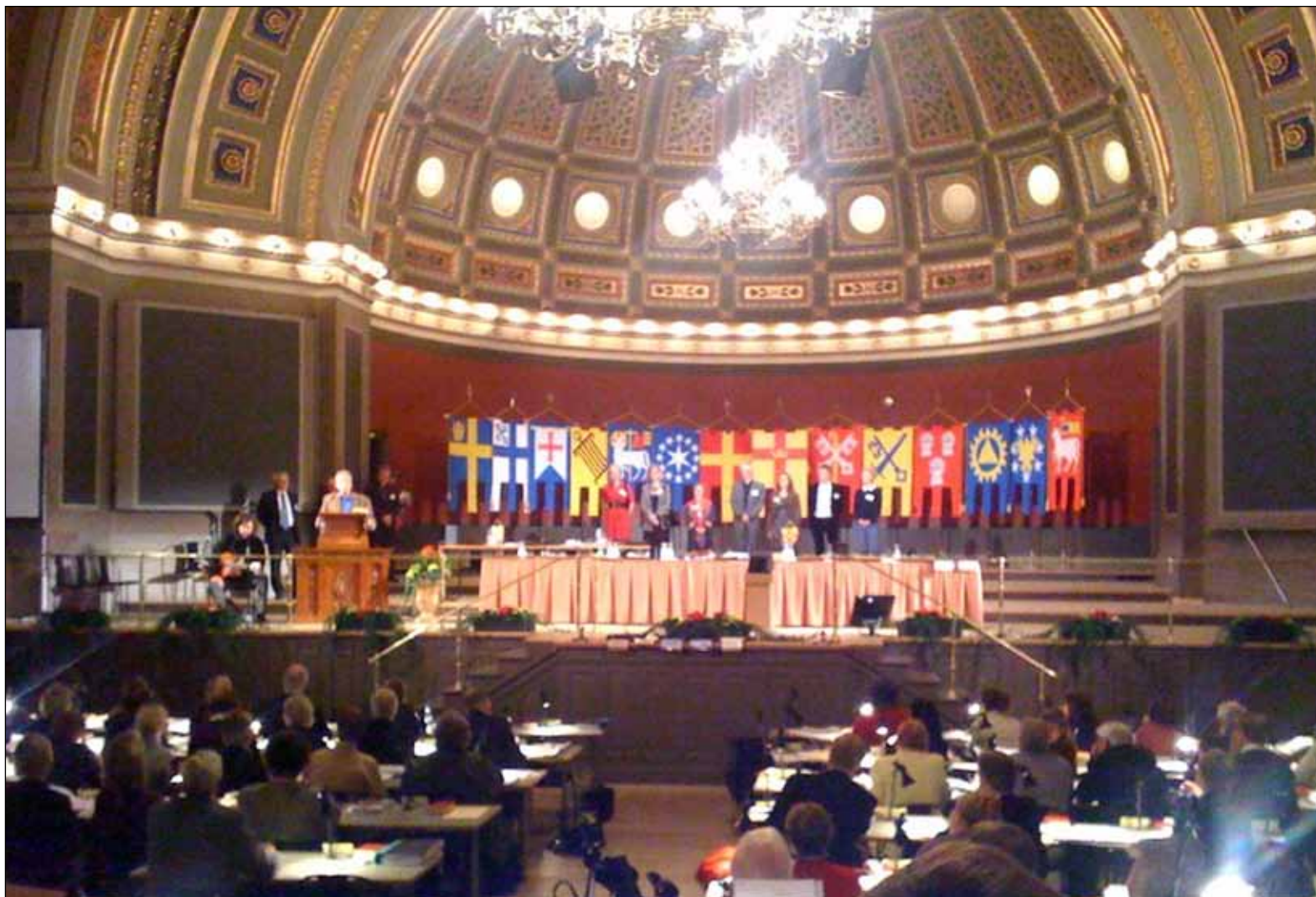
Årets kyrkomöte fick som vanligt en festlig inramning i anslutning till Uppsala domkyrka.

En annan motion efterfrågade kritisk islam-litteratur. Svenska kyrkan har gett ut mycket om islam som är förskönande och undviker motsatserna till kristendomen. Debatten kom att handla om huruvida islam kan liknas vid grupper som Jehovas vittnen eller mormonerna. De har ju också egna "profeter", som gör anspråk på att företräda en högre uppenbarelse. Mycket i Koranen är förvrängda återgivningar av bibelberättelser. I längden är en naiv hållning till islam ohållbar. Huruvida det är berättigat att svenskkyrkliga företrädare uttalar sig positivt om Ship to Gaza var ämnet för en annan motion. Här inriktades debatten kring