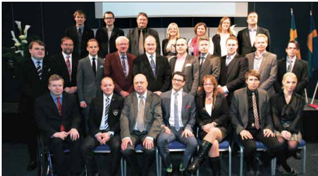
Sverigedemokraternas nya partistyrelse är redo att ta sig an partiets framtid!

V ID LANDSDAGARNA valdes Sverigedemokraternas nya styrelse respektive valberedning. Dessutom valdes revisorer och revisors-suppleanter. Dessa viktiga partiorgan fick följande sammansättningar: