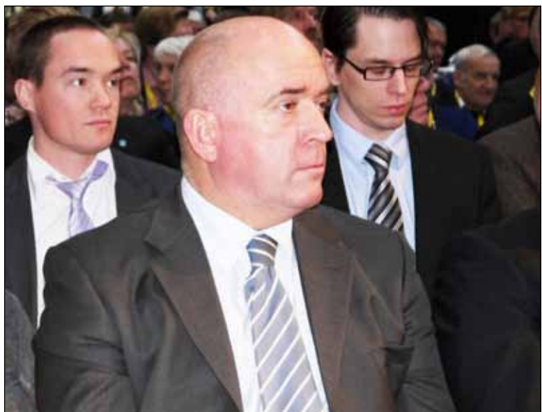
Folketingsledamot Søren Espersen, Dansk Folkeparti, höll ett mycket uppskattat hälsningstal.

E TT UPPSKATTAT inslag på landsdagarna var Dansk Folkepartis (DF) hälsning till de församlade sverigedemokraterna. Den framfördes av folketingsledamoten Søren Espersen.