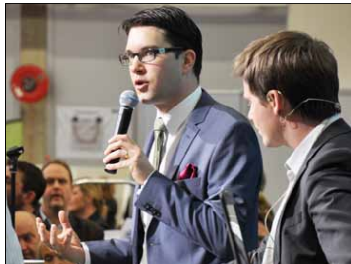
Integrationsdebatten mellan SD:s Jimmie Åkesson och integrationsminister Erik Ullenhag tilldrog sig stort intresse.

Det var andra gången PolitikerDagarna, som arrangeras av Sveriges kommuner och landsting, hölls vid Svenska Mässan i Göteborg. Inbjudan riktar sig till alla Sveriges omkring 45 000 förtroendevalda politiker.