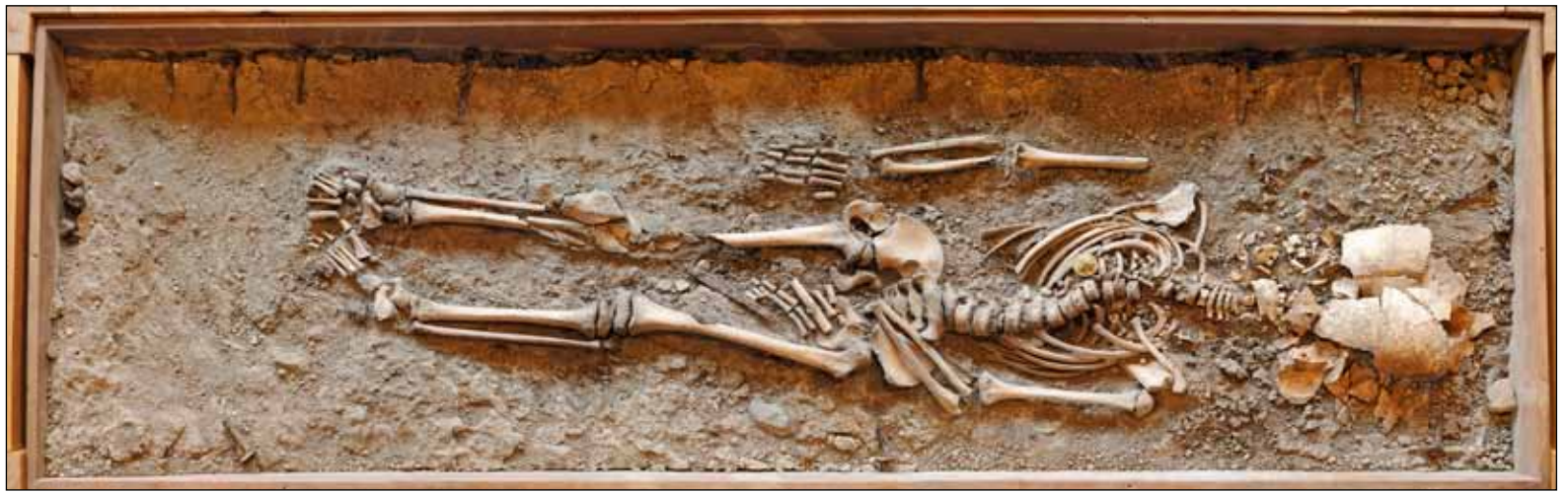
Skelettet av Birkaflickan i gravens.

alltför vanligt vid denna tid. Ungefär hälften av alla barn dog innan de fyllt 10 år under denna tidsepok. Den påkostade gravens talar också om att hennes familj sörjde henne lika mycket som dagens föräldrar skulle ha gjort, trots den stora barnadödligheten.