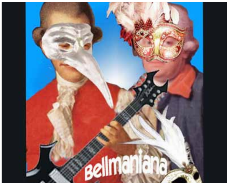
På CD:n "Bellmaniana" tolkar Ensemble Pechlin Bellman på helt nytt sätt.

Ensemble Pechlin har hämtat sitt namn efter den tysk-svenske militären och politikern Carl Fredrik Pechlin (1720-96), en nyckelfigur i mordkomplotten mot Gustaf III och avliden på Varbergs fästning 1796. En välkommen framgång fick