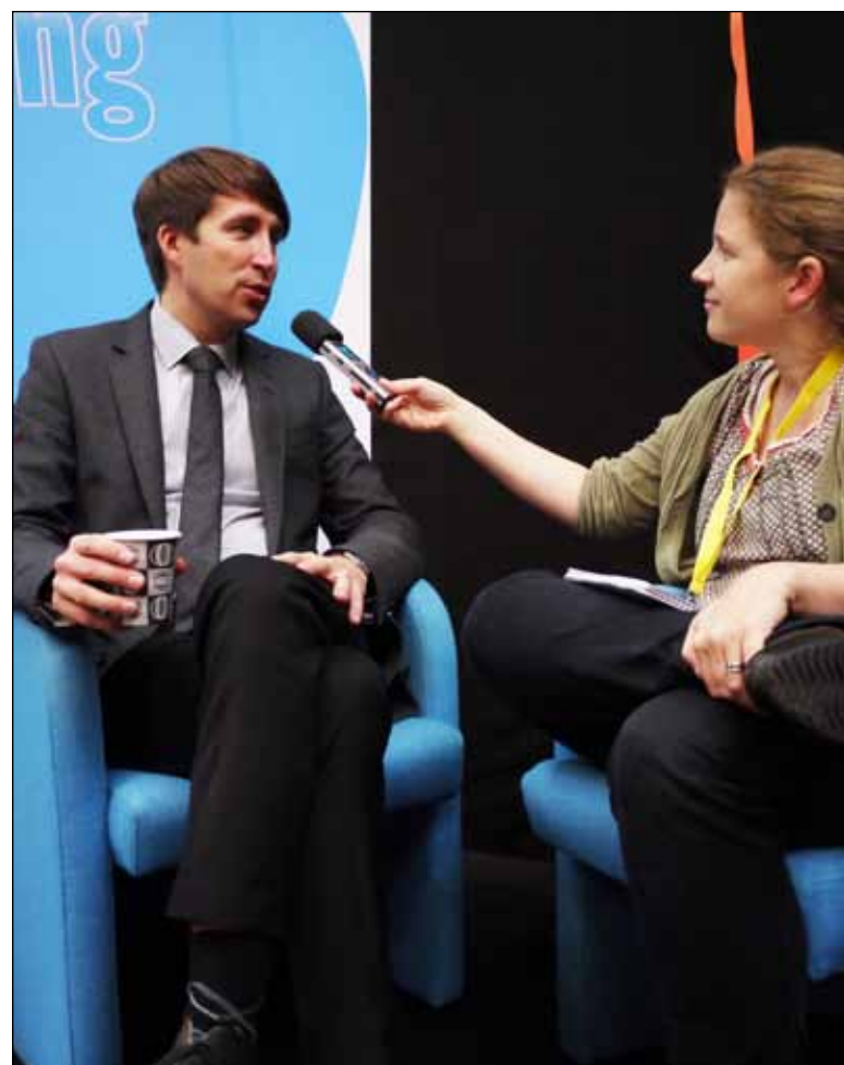
Richard Jomshof i partistyrelsen blev föremål för medias intresse.