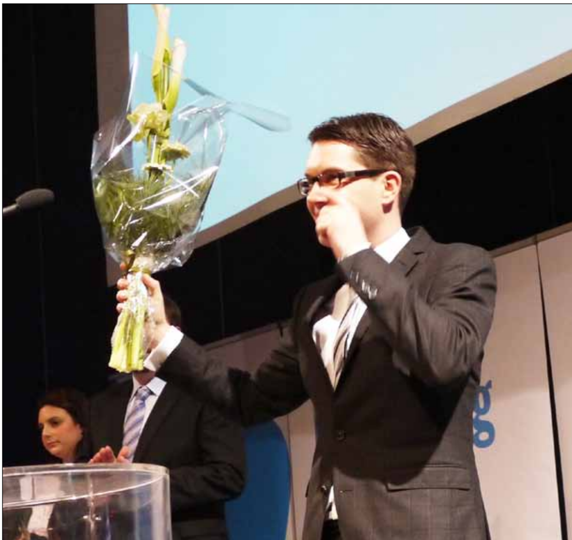
Jimmie Åkesson var full av tillförsikt i sitt partiledartal vid landsdagarna och menade, att SD på sikt kan bli ett "trettioprocentparti".

– Partivänner, vi har till skillnad från Fredrik Reinfeldts Nya Moderater visioner, framhöll Jimmie Åkesson. Socialdemokraterna är i sin tur upprörda över vår folkhemsvision och vår uppskattning av Per Albin Hansson. Då säger vi att det är