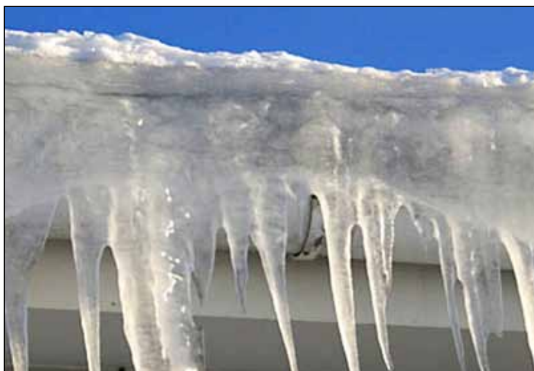
Istappar – vackert men farligt. En SD-motionär vill införa kommunal istappsstelefon.

Boden är ytterligare en kommun i vilken SD har lyckats påverka ge-