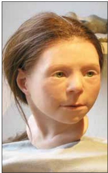
Så här kan Birkaflickan ha sett ut.

Förmodligen dukade hon under för en enkel sjukdom vilket var