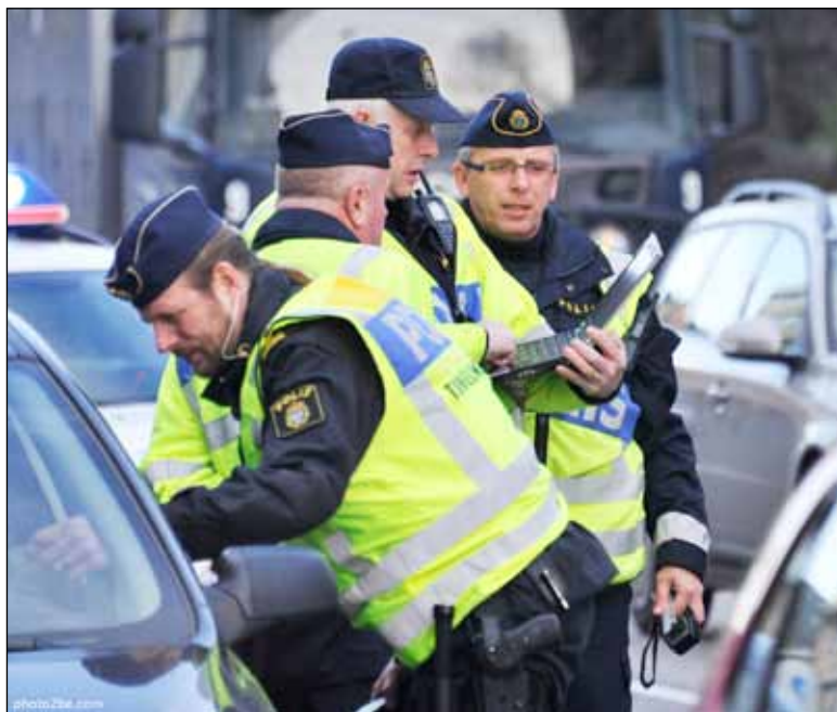
SD:s betoning av lag och ordning, inte minst i det nya kriminalpolitiska programmet, torde vara en viktig faktor bakom SD:s framgångar i väljaropinionen.

av YouGov den 13 november. Här går vårt parti fram till 13,1 procent avseende riksdagsväljare och 13,0 när det blir fråga om region Skåne. Detta kan jämföras med 9,9 respektive 9,4 procent i riksdagsvalet 2010. Den nedåtgående trenden för Juholt och sossarna håller i sig.