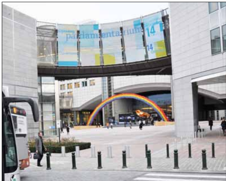
EU-högkvarteret i Bryssel – härifrån utgår all makt i den europeiska gemenskapen.