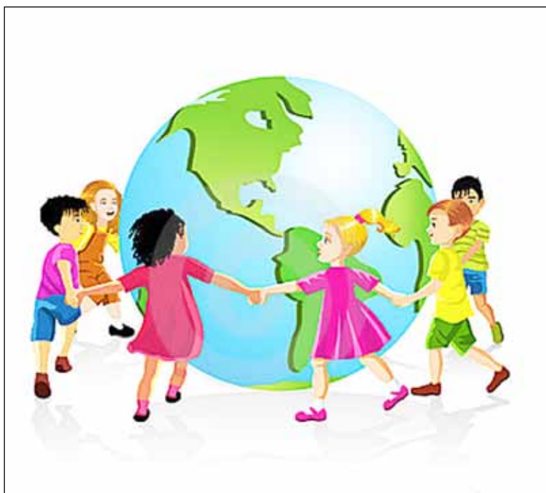
Barnen är mänsklighetens framtid över hela världen.

Kommuner där barn som inte mår bra av en tidig separation från föräldrarna, eller av att vistas i stora barngrupper, tvingas till förskolan