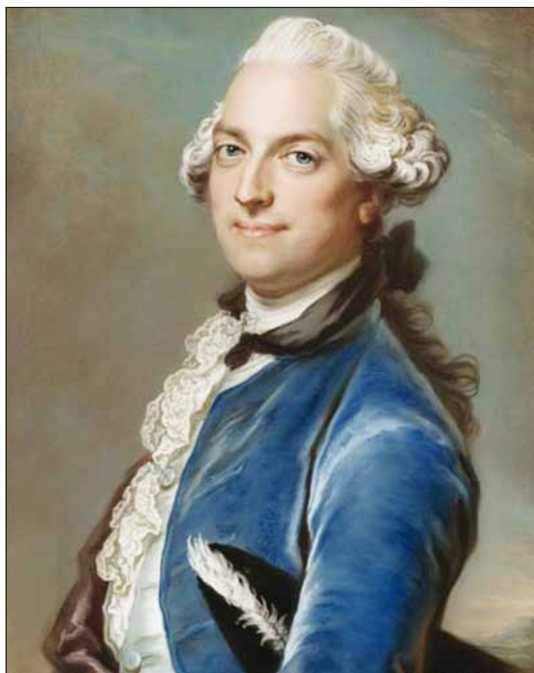
Greve Gustaf Fredrik Gyllenborg (1731-1808) var en av sitt sekels mest framstående diktare.

Efter Hedvig Charlotta Nordenflychts tragiska död 1763 upplöstes Tankebyggareorden. ■