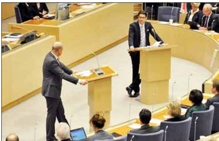
Statsministern i en replikduell med Åkesson.

Ingen av partiledarna gjorde bort sig märkbart (Fridolins miss får ändå ses som av det mindre slaget) och de mer eller mindre nya partiföreträdarna torde retoriskt ha uppfyllt partimedlemmarnas alla förväntningar, detta sagt med även med tanke på att