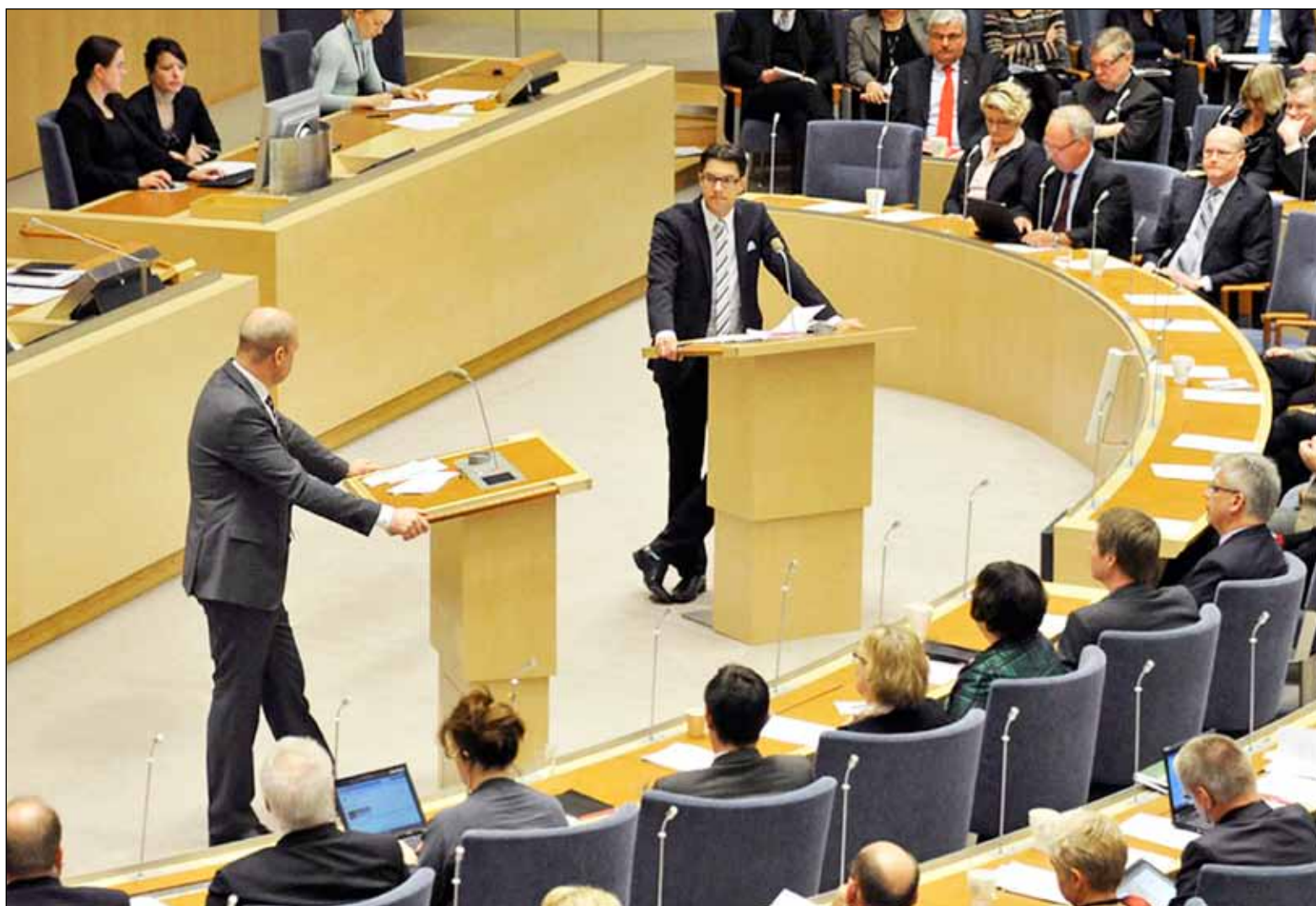
SD:s partiledare Jimmie Åkesson gjorde sitt bästa för att öppna riksdagsledamöternas ögon inför det helt oacceptabla våldet i Malmö, vilket hotar vitala samhällsinstitutioner. Här i ett replikskifte med statsminister Fredrik Reinfeldt.

► Varje år håller riksdagen traditionsenligt en partiledardebatt, i början av året. Varje partiledare har tio minuter på sig att redogöra för partiets politik. Årets debatt var intressant i flera avseenden.