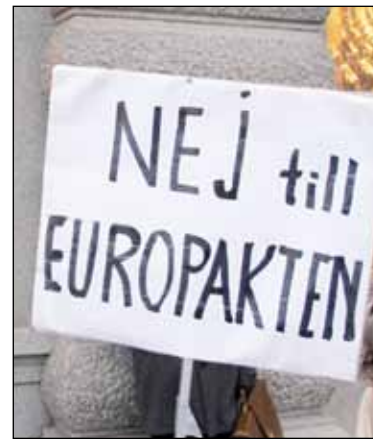
Demonstranter protesterar mot Sveriges planer på att gå med i europakten.

ropakten, i likhet med det mesta av krisåtgärder Bryssel företagit sig, har haft som främsta syfte att rädda det omhuldade federalistiska symbolprojektet, euron, från undergång. Denna prioritering har medfört att sunda ekonomiska åtgärder för Europa, men som äventyrar eurons fortbestånd och ställning inte kunnat hävdas i diskussionen mot åtgärder och beslut som varit både ekonomiskt osunda och odemokratiska men starkt europrotektionistiska.