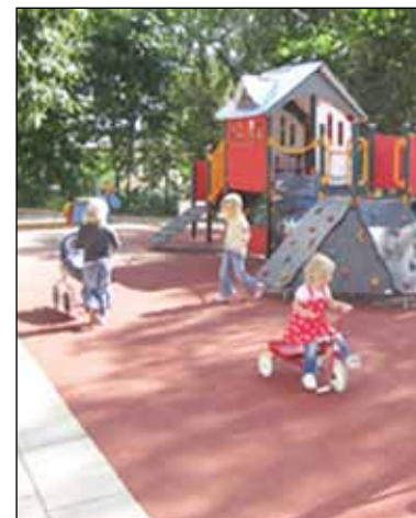
Det är alltför ofta man tvingas konstatera, att barnperspektivet lyser med sin frånvaro.

Sammanfattningsvis finns det bara en väg att gå för den politiker som menar att hänsyn ska tas till barnperspektivet. Denna väg innebär att barnen måste få kosta! Den innebär också att varje enskild politiker måste vara ödmjuk nog för att kunna ta bort de ideologiska skygglappar som hindrar att det enskilda barnets unika behov syn-