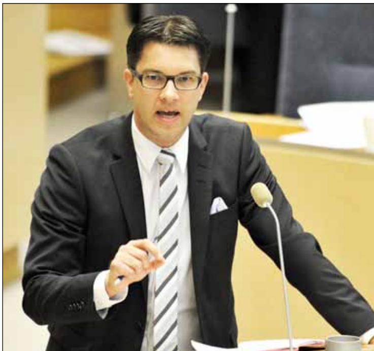
Jimmie Åkesson föreslog en kriskommission för att komma till rätta med de svåra problemen i Malmö.

Replikerna, som varje partiledare har rätt till efter ett anförande, visade att Åkesson tyvärr inte nådde