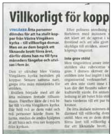
Text om koppartyvorna ur Katrineholms-Kuriren .

Ett annat fall där media varit ovilliga att haspla ur sig rätt etnicitet gäller den ”15-årige pojke” vilken sköts till döds nyårsnatten i det ökända området Rosengård i Malmö. 15-åringen har istället närmast beskrivits som en exemplarisk ung man som blev ett oskyldigt offer för det utbredda våldet i Malmö.