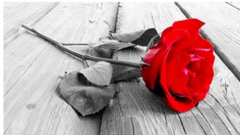
Det är viktigt att hela förbundet sluter upp bakom utsatta medlemmar.

I ett fall betalades även hemförsäkringens självrisk. Ungdomar är generellt en ekonomiskt relativt ut-