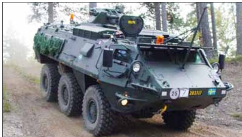
Vilken glädje har vi haft av Moderaternas plåtschabrak?

Pbv 501 kom knappast att användas i Sverige, eftersom de tre brigader som skulle få vapentypen lades ner då cirka 100 vagnar levererats