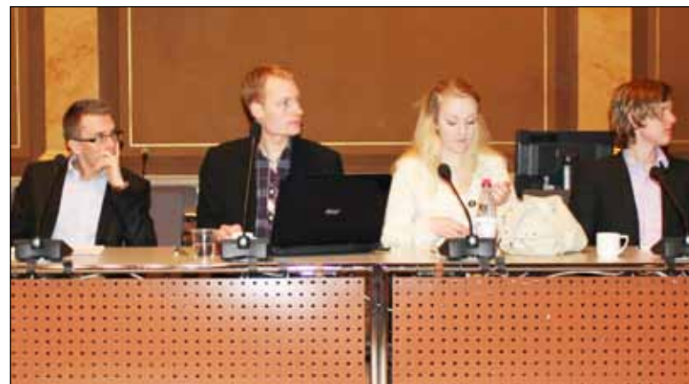
Konferensdeltagarna lyssnade intresserat på talarna.