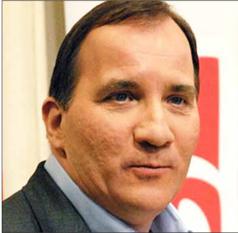
Stefan Löfvens klasstillhörighet är ointressant i modern svensk politik.

gångsrika i att övertyga merparten väljare om det förträffliga i sin ”arbetslinje”. Denna framstår som fördelaktig vid en jämförelse med sossarnas ”bidraglinje”, vilken i allt högre grad kommit att förknippas med en allt stridare ström av immigranter.