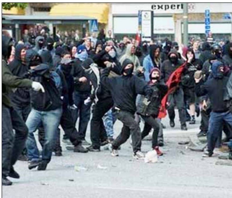
Vänstermobben i aktion – AFA och diverse andra revolutionära grupper utgör ett fortsatt hot mot demokratin i Sverige.

Men även män har drabbats. Bland dessa märks moderaten Oli-