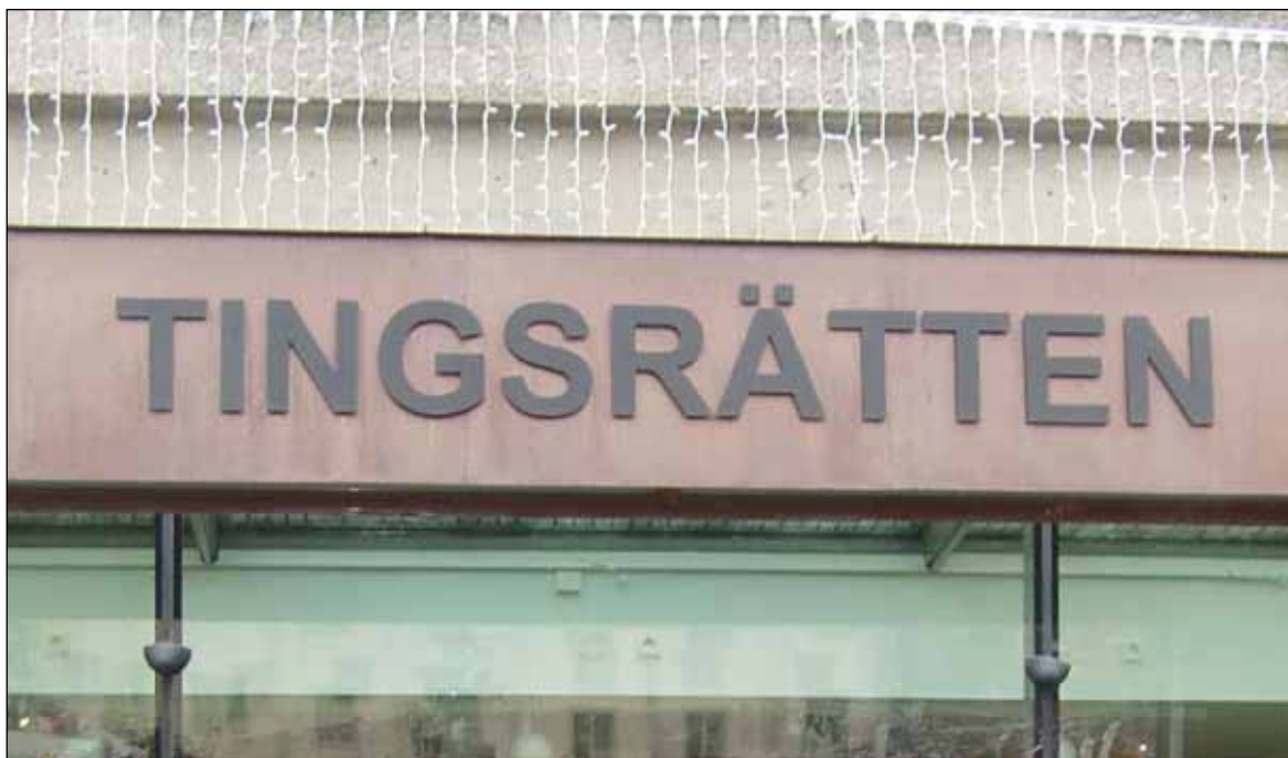
Strängare straff behövs inom det svenska rättsväsendet, anser artikelförfattaren Kent Ekeroth. På bilden Södertälje tingsrätt.

Vem skulle våga skräpa ned om man fick 100 år i fängelse som