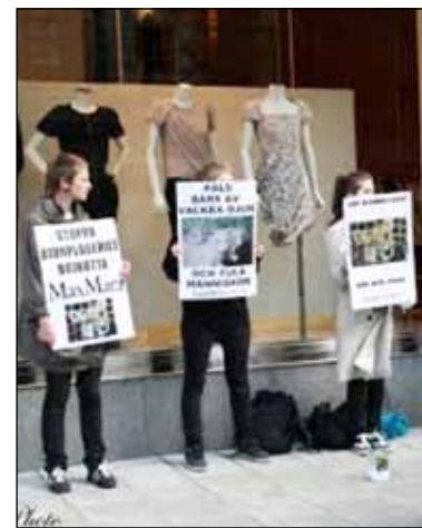
Militanta djurrättsaktivister och pålsmotståndare hotar den fria företagsamheten.

”Rättssystemet har visat sällsynt slapphet mot vänsterextremismens härjningar”, skriver nätsajten Veckans Contra . ”Domen i Göteborg