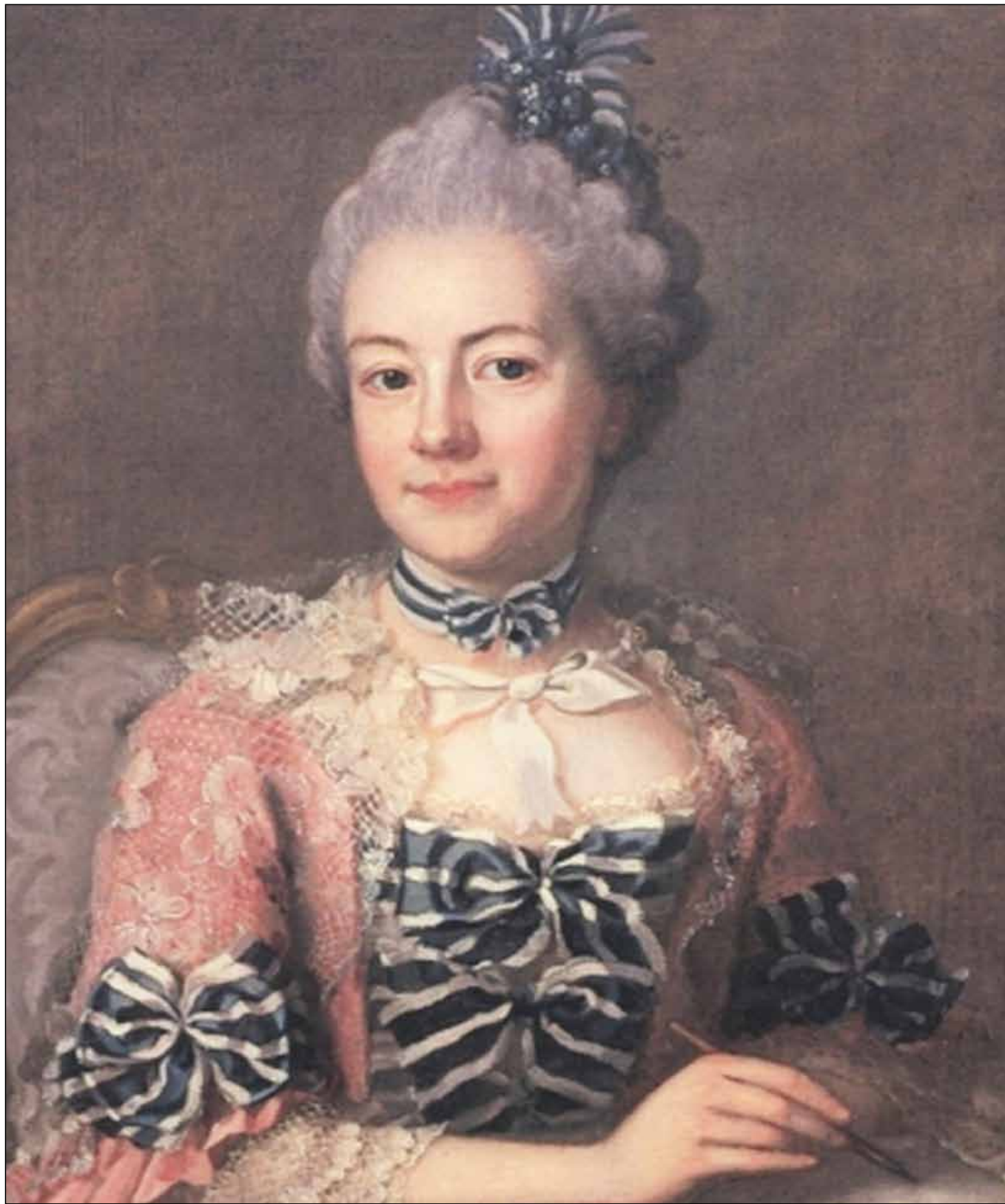
Hedvig Charlotta Nordenflycht (1718-63) var en av våra första kvinnosakskämpar och en av våra främsta lyriker. Porträttmålning av Pasch.