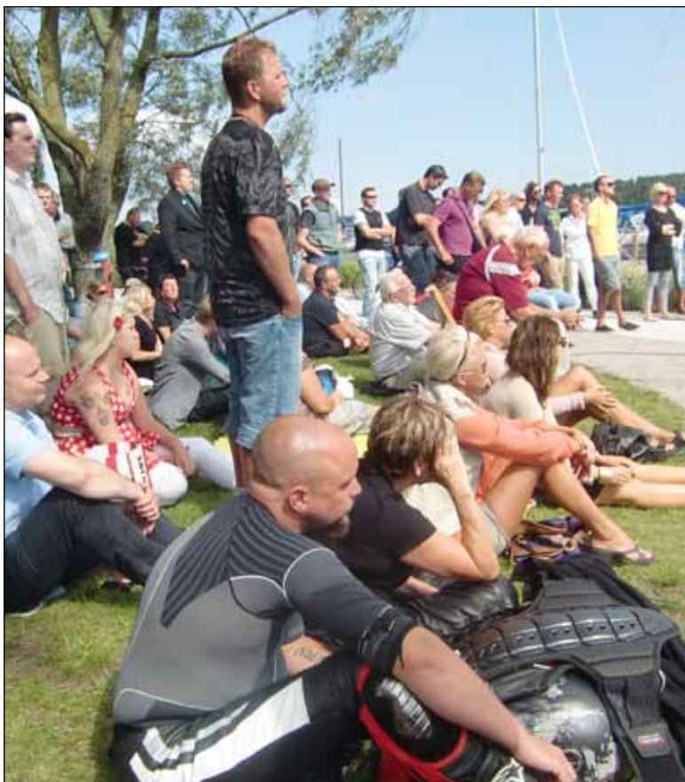
Här några av alla de åhörare/åskådare som följde Jimmie Åkessons sommartal med spännt intresse.

Den norske terroristen beskriver sig vidare som ”kulturkonservativ”