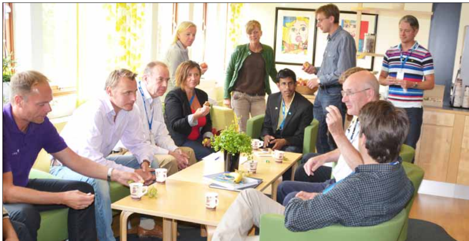
Glatt gäng som trivs och hade trevligt tillsammans.

Våra valda gruppleddare och politiska sekreterare i regioner och landsting träffades i Jönköping den 8 augusti för att lära känna varandra och för att diskutera hur landstingspolitiken på sikt ska utvecklas.