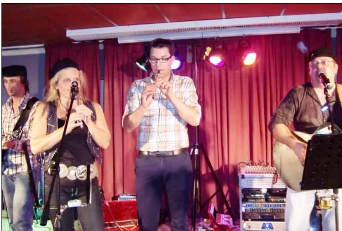
Han lät kanske inte som James Galway, Jimmie Åkesson, men ett uppskattat framträdande gjorde han..