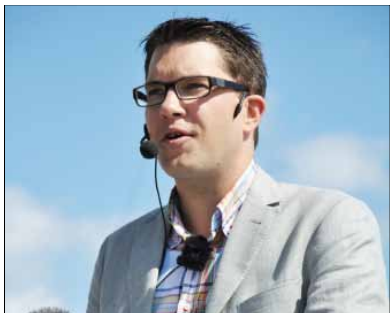
Jag kommer aldrig att skuldbelägga fredliga muslimer, framhöll Jimmie Åkesson bland annat i sitt uppmärksammade sommartal.