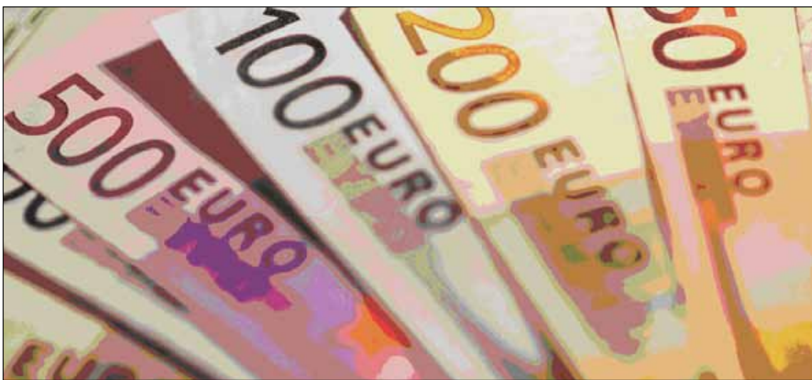
Somliga vill köra över medborgarna och införa euron över svenska folkets huvuden..

För Sveriges vidkommande tillkommer också den besvärande omständigheten och paradoxen,