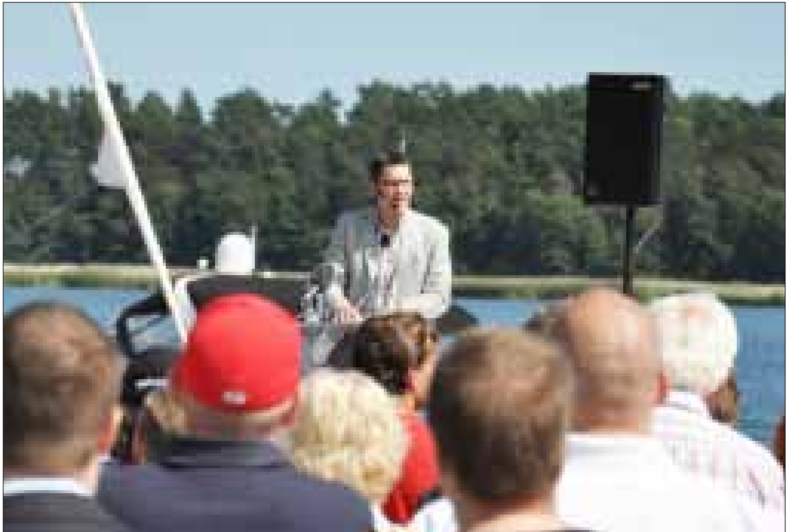
Omkring 500 personer hade samlats i småbåtshamnen i Sölvesborg för att lyssna till Jimmie Åkessons andra sommartal.

– Trots att det här måste vara den kanske sorgligaste och svåraste perioden i hans liv – både på ett personligt och på ett politiskt plan – så har han hållit balansen, sagt det nationen vill och behöver höra. Tryggt och stabilt. Inga överord, inga hätska utfall. Han har också varit tydlig med en sak som jag vill framhålla som särskilt viktig, nämligen att olika åsikter skall accepteras i en demokrati, att de här förskräckliga händelserna inte får leda till häxjakt på åsikter man inte delar.