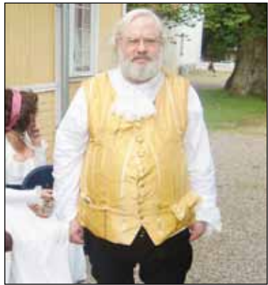
Artikelförfattaren i 1700-talsmundering – rocken hade åkt av i värmen.

Hjärne var född i Ingermanland, och efter universitetsstudier i Dorpat i nuvarande Estland flydde han till Sverige på grund av krig. Han upptog medicinstudier i Uppsala 1658 och blev lärjunge till bland andra Olof Rudbeck den äldre. En tid var han greve Clas Totts livläkare i Riga innan han reste till Nederlän-