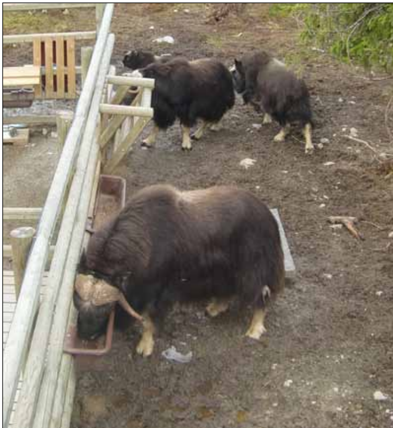
Några av myskoxhägnets invånare äter med god aptit.

– Vi har fått våra älgar från Bjurholm i Västerbotten, säger Christi-