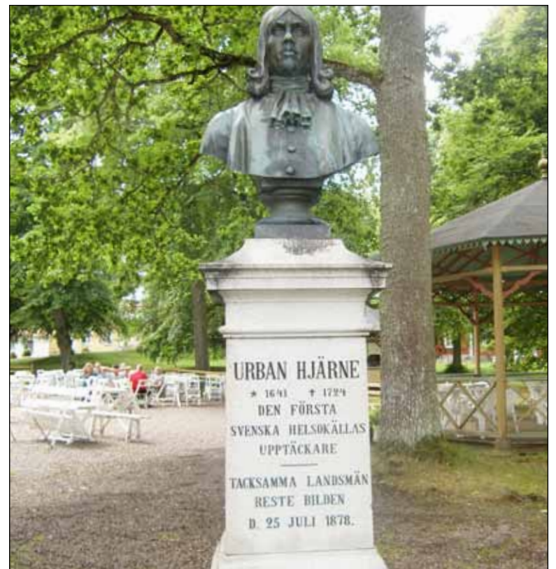
På brunnsområdet finns denna byst föreställande Urban Hjärne.