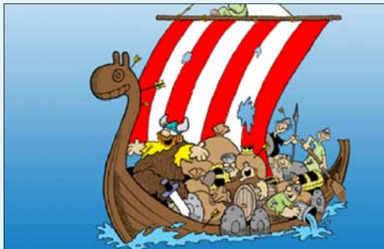
Den animerade vikingahövdingen Hagbard Handfaste ombord på sitt skepp efter ett lyckat plundringståg. Teckning: Dik Browne

Klart är att ordet förekommer i gamla tiders diktverk såsom det anglosaxiska Widsith och Beowulfkvädet samt på runstenar. På en av runstenarna i Västra Strö-monumentet i Skåne från slutet av 900-talet står följande att läsa: Fader lät dessa runor hugga efter sin broder Asser, som fann döden nordpå i viking. Här avses med ordet viking "härfärd över havet".