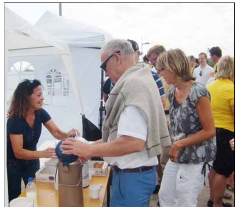
Glad och trevlig personal serverade kaffe och kakor för den som ville ha.